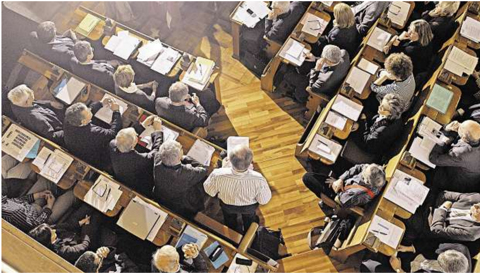
Kirchensynode im März 2011 im Zürcher Rathaus: Auch nach den Neuwahlen vom Mai werden vor allem die Bisherigen die Szene bestimmen