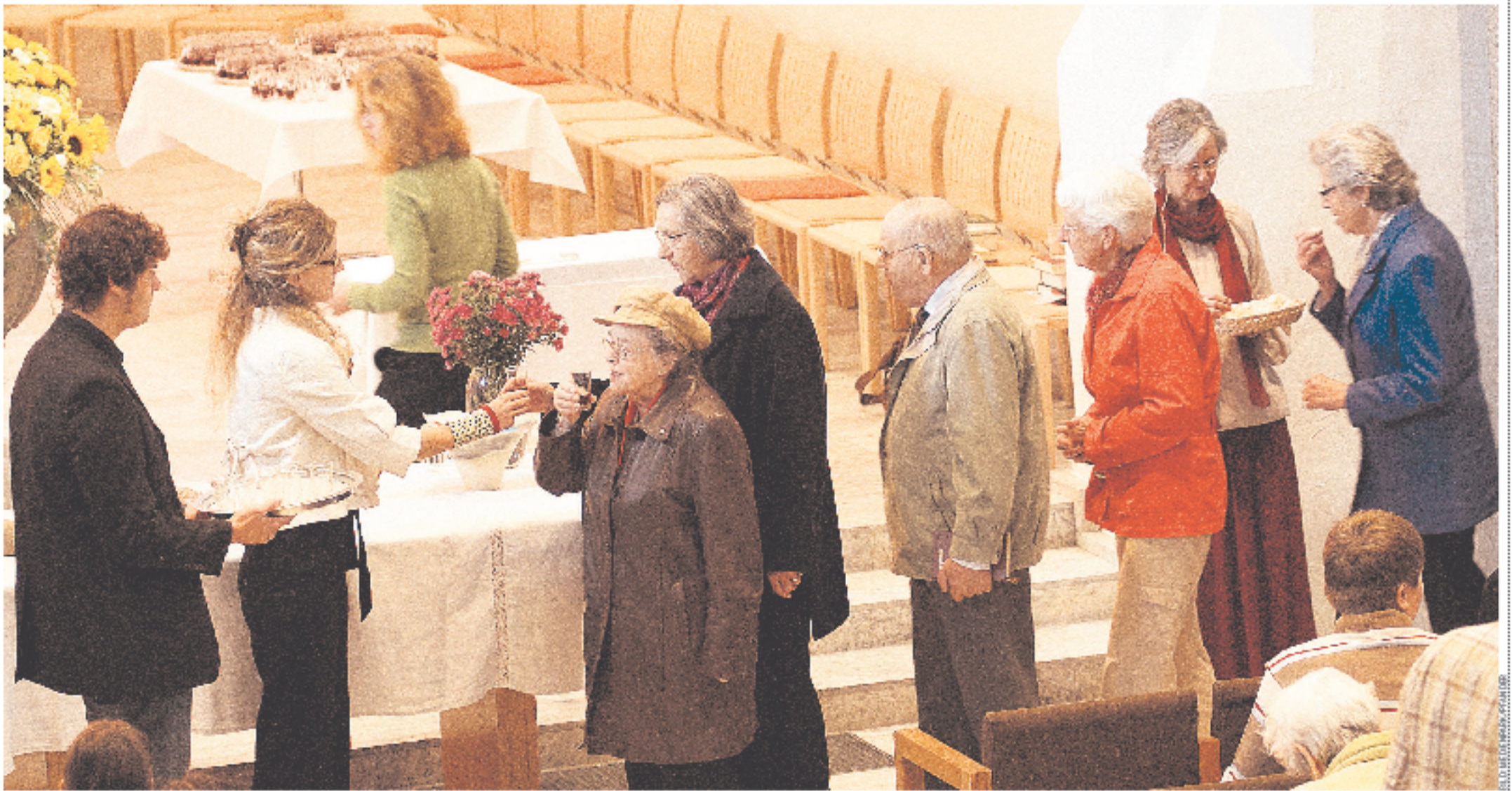
Aus dem Sättigungsmahl der ersten Christen ist ein kirchliches Ritual geworden, das in unterschiedlichen Formen gefeiert wird.