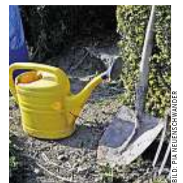
Der Frühling meldet sich

REFORMIERT. 25.3.2011 Fukushima: «Nichts ist mehr, wie es vorher war»