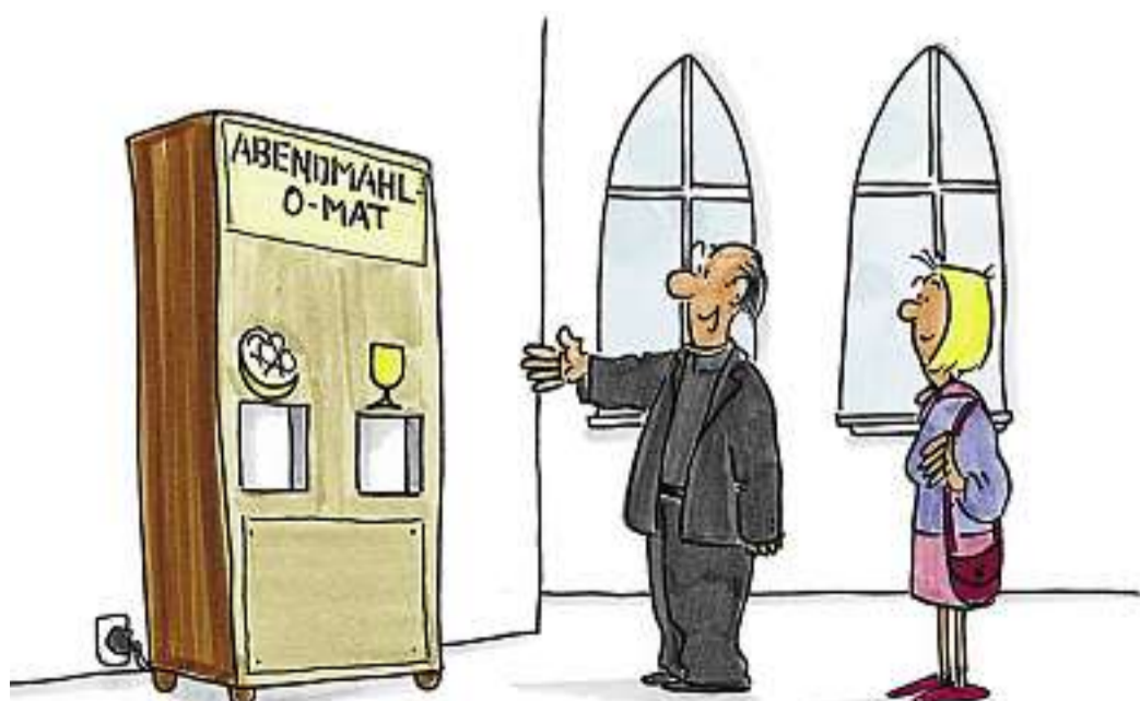
"DAMIT HABEN WIR DAS HYGIENE-PROBLEM GELOST."