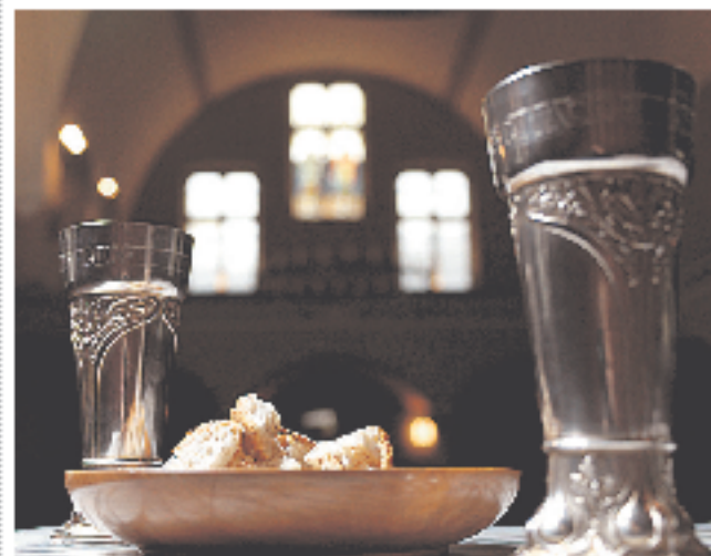
Brot und Wein – als Zeichen für Leib und Blut Jesu