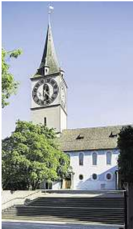
Kirche St. Peter in Zürich