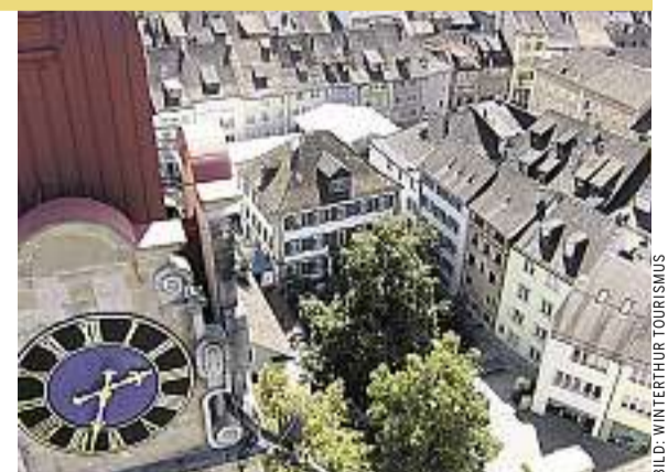
Über Freiwilligenprojekte: ein Austausch in Winterthur

ternehmen aus verschiedenen Städten stellen ihre Projekte zur Diskussion, nennen die Erfolgsfaktoren und motivieren die Teilnehmenden, selber Ideen zu entwickeln. Der Anlass richtet sich an NPO, engagierte Freiwillige, Unternehmen und Interessierte aus Politik und Bildung.