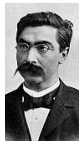
Der reformierte Theologe Leonhard Ragaz (1868 – 1945) war Wegbereiter des «religiösen Sozialismus» und Mitbegründer der religiös-sozialen Bewegung.

SOLIDARISCH. Vor genau 99 Jahren organisierten sich in der Zürcher Synode Pfarrer und Laien als Religiös-soziale Fraktion (siehe den Beitrag zum Jubiläum S. 7). Ihre Theologie richtete sich am religiösen Sozialismus von