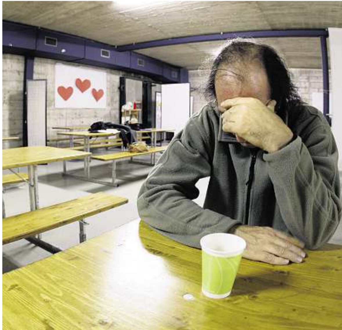
Zur Bekämpfung der Armut braucht es Nothilfe (hier Obdachlosenunterkunft in Genf), aber auch politische Entscheide

ARMUT/ Schon immer war die Armut ein Thema für die Kirchen. So auch für die Evangelische Allianz, die dabei in letzter Zeit verstärkt auf die Politik setzt.