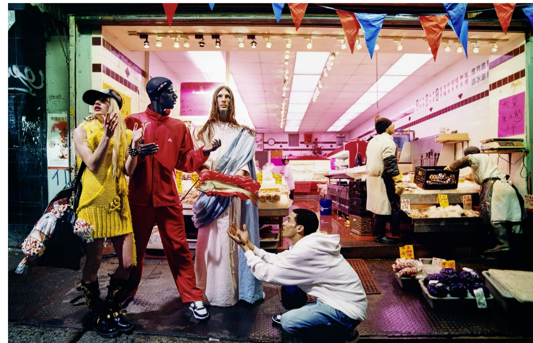
Anspielung auf die Speisung der 5000: Jesus verteilt Brot und Fisch vor dem Supermarkt.