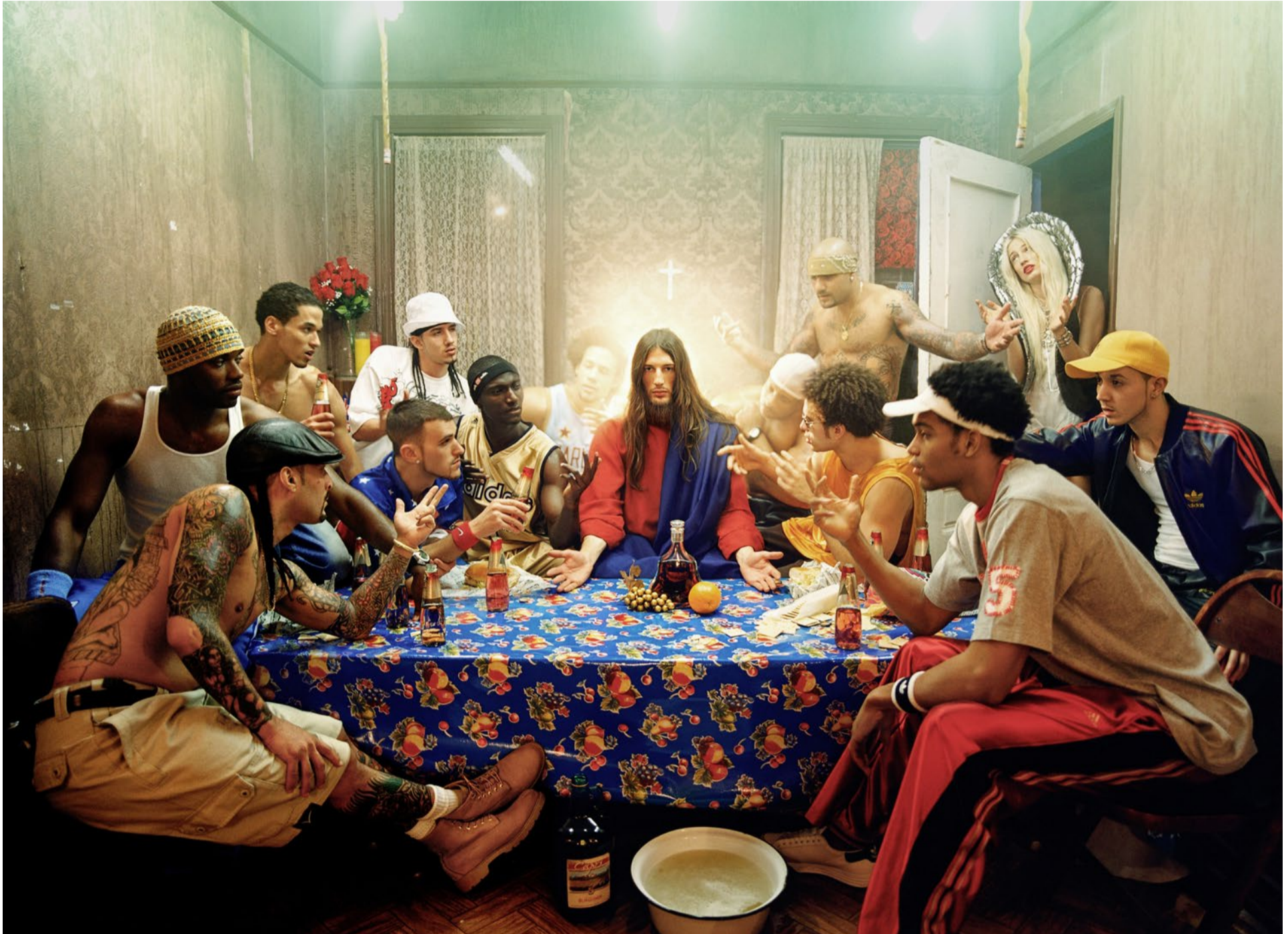
Jesus in der Bildsprache der Popkultur: Das letzte Abendmahl.

Foto: David LaChapelle, Jesus Is My Homeboy: Last Supper , New York, 2003 ©David LaChapelle