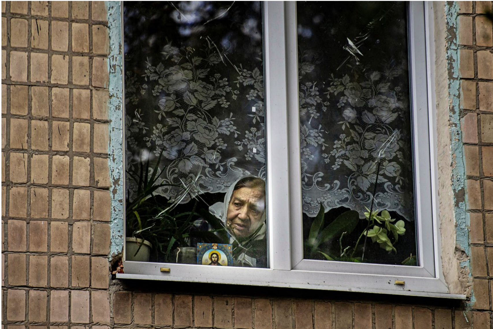
Diese Ukrainerin ist auf die Hilfe einer humanitären Organisation angewiesen.