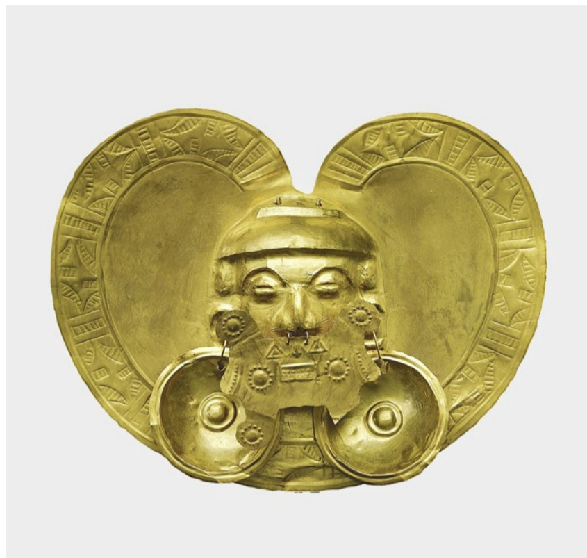
Kolumbianische Brustplatte mit Gesicht aus Goldlegierung.

Mehr als Gold – Glanz und Weltbild im indigenen Kolumbien. 22. März bis 21. Juli, Museum Rietberg, Zürich. www.rietberg.ch