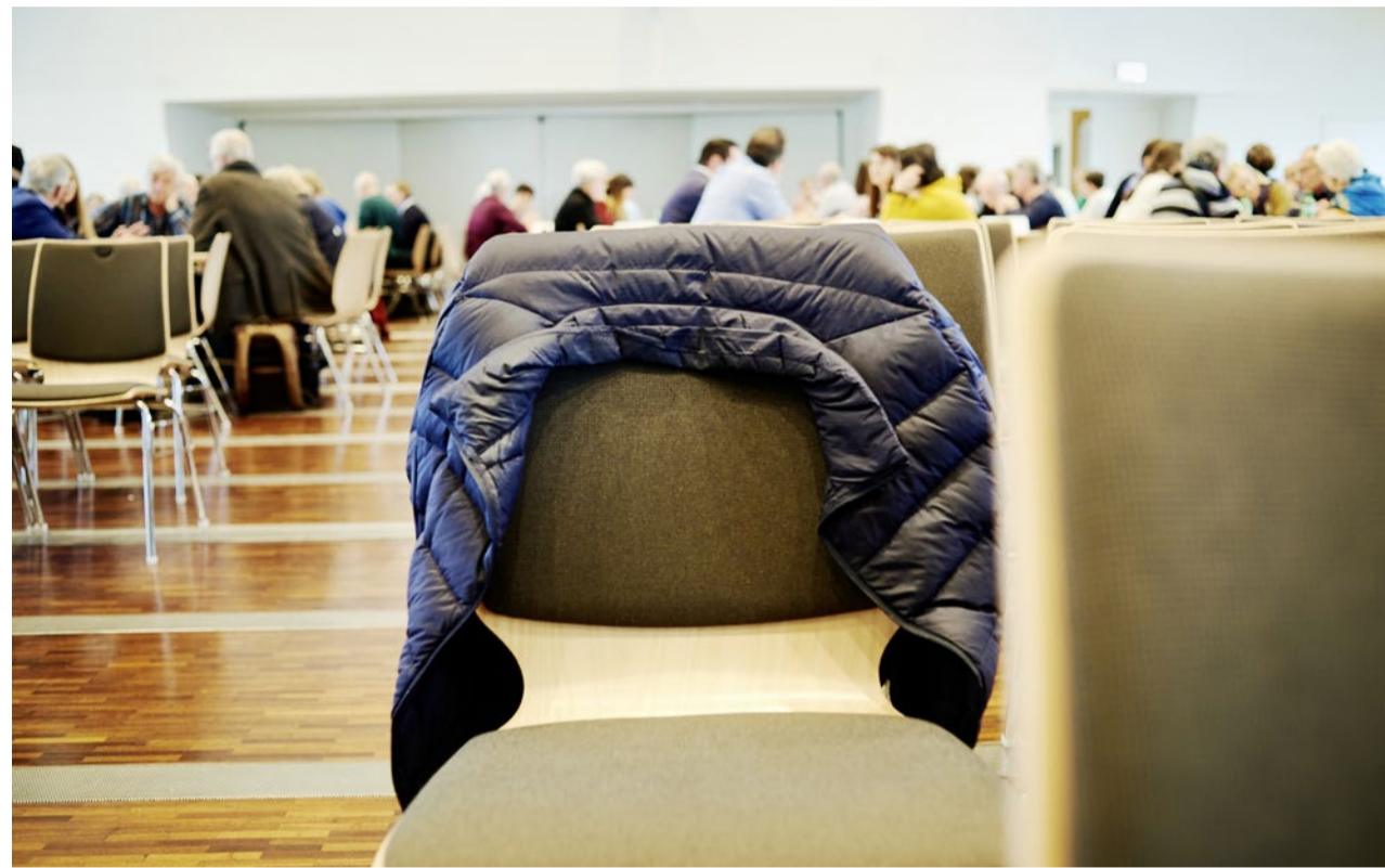
Welche Botschaften und Strukturen soll die Kirche haben? In Suhr rauchten die Köpfe.

Reform Ohne Zerknirschtheit diskutierten 200 Menschen an der Gesprächssynode in Suhr die Ziele der Kirchenreform 26/30. Die Kirche solle aus ihrer Blase heraustreten und Vielfalt leben, lautet der grundsätzliche Tenor.