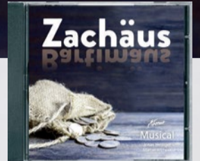
CD erhältlich am CD-Tisch oder auf adonishop.ch

Ein packendes Musical über Einsamkeit und Verbundenheit, Chancen und Grenzen des Wohlstands und die Sehnsucht nach Frieden. Der stimmungsvolle Chorgesang und die ausgefeilten Arrangements transportieren die tiefgründigen Texte wunderbar in unsere Zeit. Lassen auch Sie sich von dieser biblischen Geschichte in den Bann ziehen!