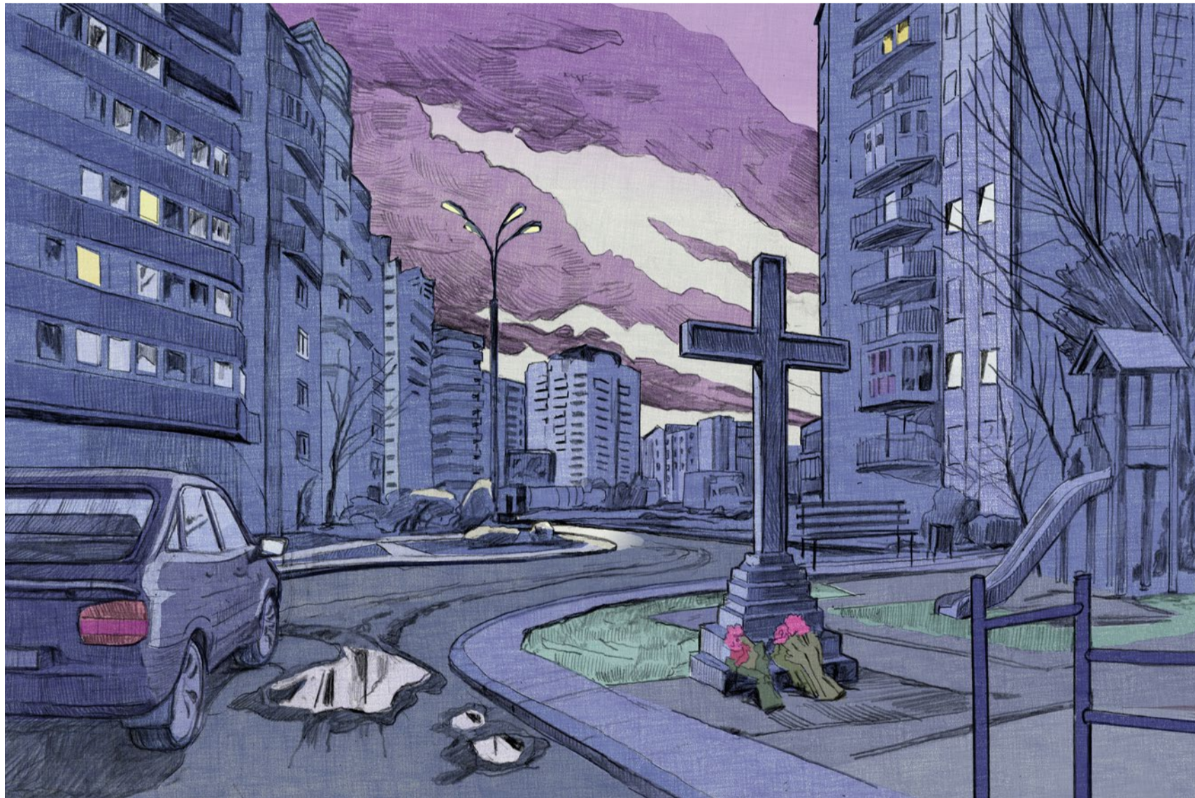
Illustration: Christoph Fischer

Karfreitag Die Passionsgeschichte erzählt vom wahren Martyrium und bewahrt davor, das Leiden zu überhöhen. Die Trauer und auch die Wut von Karfreitag gilt es auszuhalten. Ostern muss warten.