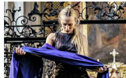
Frühlingstanz im Kloster.