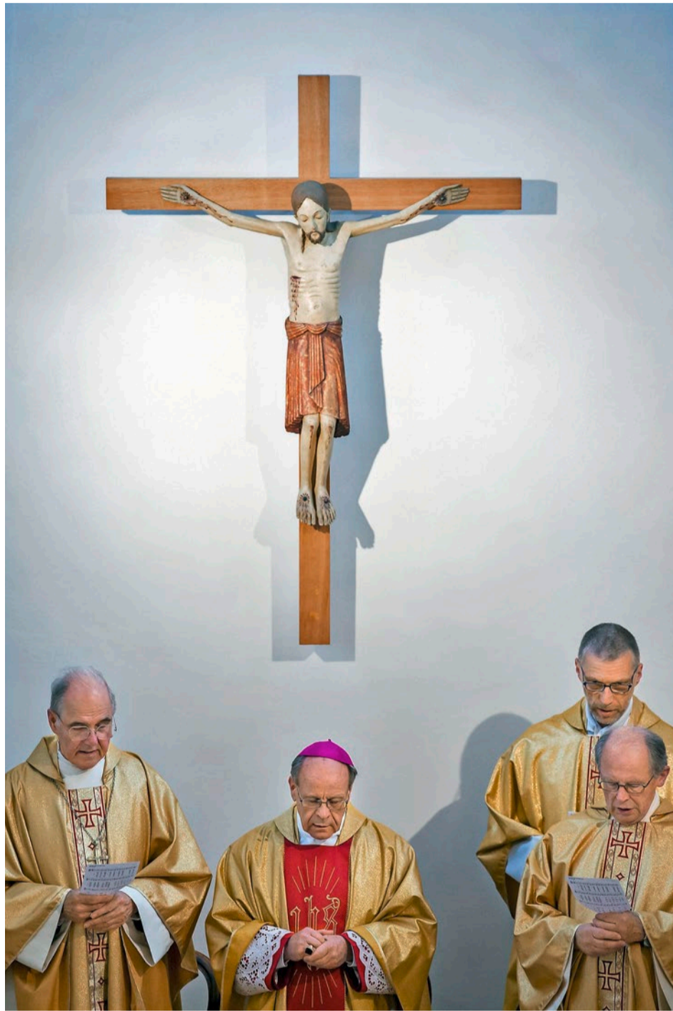
Darf zwei Jahre weiterwirken: Vitus Huonder (Mitte)

KONFLIKT/ Vitus Huonder bleibt. Der Papst belässt den umstrittenen Bischof bis Ostern 2019 im Amt. Der Entscheid aus Rom rührt den Bischof und schockiert seine Gegner.