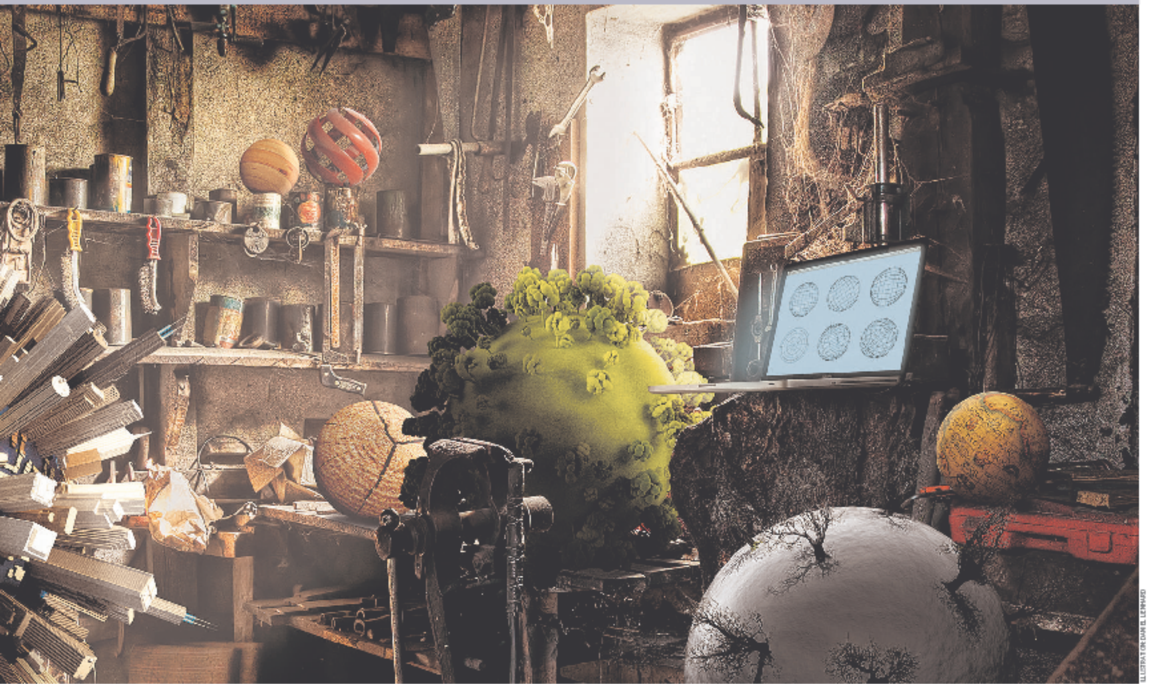
ILLUSTRATION: DAVID E. LEPPAS