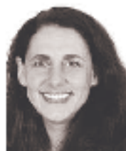
JACQUELINE BADRAN, 50 ist Biologin, Ökonomin, Unternehmerin und SP-Nationalrätin. Ihr Schwerpunkt ist die Boden- und Immobilienpolitik.