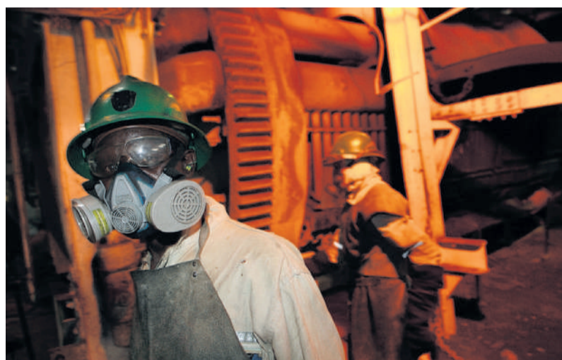
Schuffen für Schweizer Rohstoffkonzerne: Arbeiter in der Glencore-Mine «Mopani Copper Mine» in Sambia

Auch das Geschäftsgebaren der Glencore-Mine «Mopani Copper Mine» in Sambia lässt aufhorchen: 800 Menschen wurden 2008 in der Minenstadt Mufulira aufgrund toxischer Abwässer hospitalisiert. Zudem hat der Konzern das geförderte Kupfer und Kobalt jahrelang unter dem