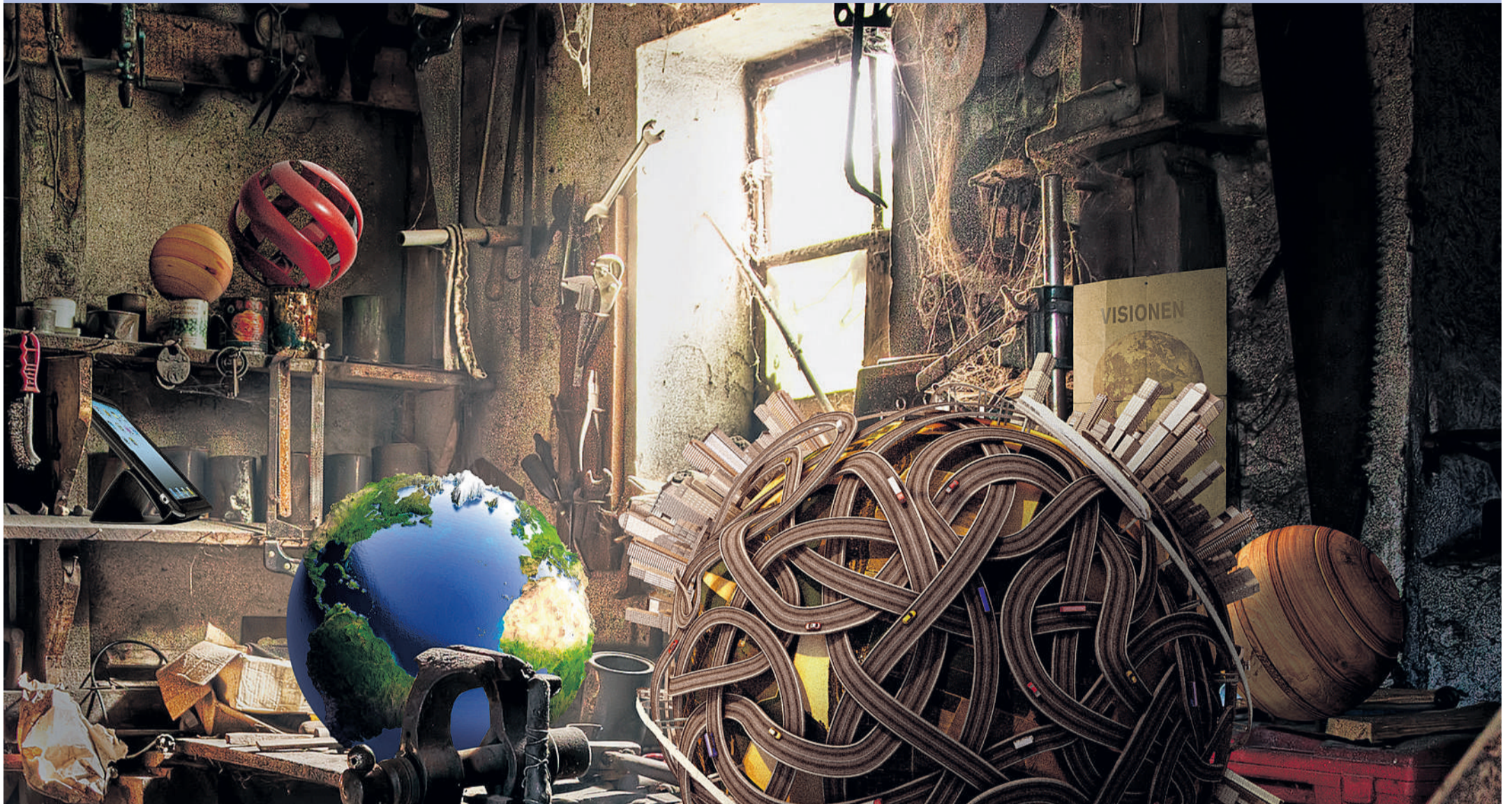
Zukunftswerkstatt: Was ist zu tun, damit die Welt auch morgen Lebensraum für Menschen, Tiere und Pflanzen bleibt?

AUFBRUCH/ Gerechter, langsamer, bescheidener: Strategien zur Bewahrung des Lebens