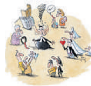
CARTOON: MAX SPRING

Pfarramt im Spannungsfeld der unterschiedlichen Ansprüche