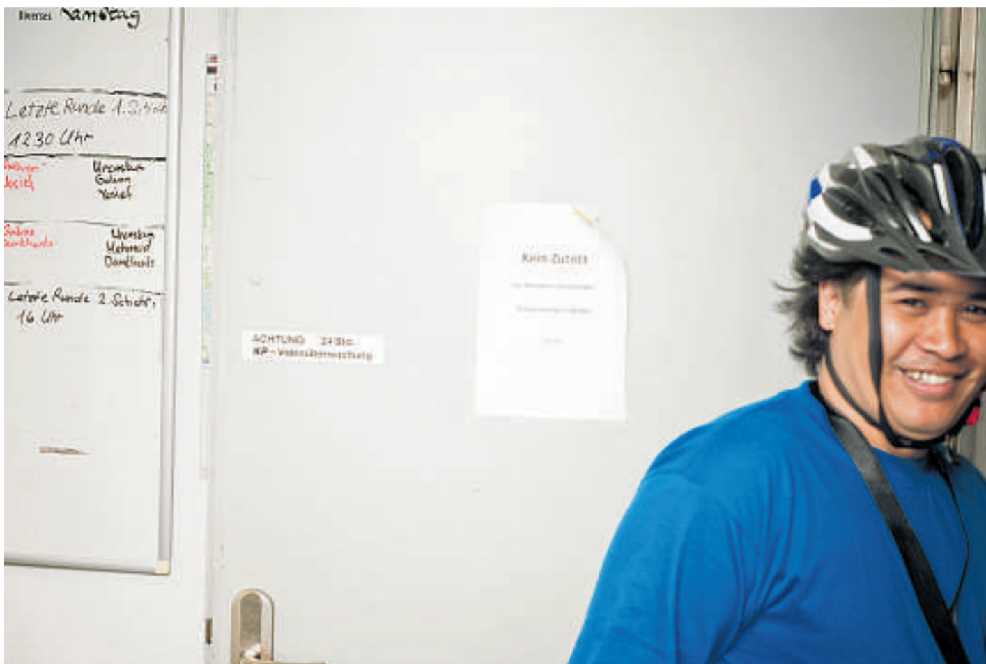
Ob Hauslieferung oder Abholdienst, der Heks-Velokurier ist schon unterwegs

«HEKS ROLLT»/ Veloverleih und Hauslieferdienste – rechtzeitig für die Sommersaison hat Heks sein Sozialprojekt für Erwerbslose erweitert.