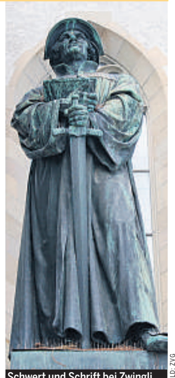
Schwert und Schrift bei Zwingli

ÖFFENTLICHE KIRCHE – Kirche im öffentlichen Raum. 22./23. Juni, Kirchgasse 9, Zürich. Kosten für zwei Tage mit Imbiss und Lunch: Fr. 150.–, ein Tag: Fr. 75.–. Auskünfte und Anmeldung bis 17. Juni: christina.ausderau@kirchenentwicklung.ch