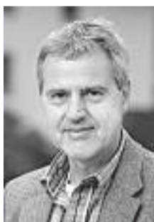
THOMAS ILLI PRO

Sonderzonen mit hoher Wohnqualität in Obwalden, wo Reiche quasi ausserhalb des für Normalsterbliche gültigen Baurechts ihre Villen errichten könnten;