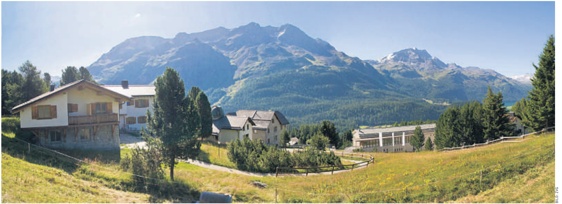
Das Ferienzentrum Randolins am Luxushügel von St. Moritz. Geschätzter Gesamtwert: hundert Millionen Franken