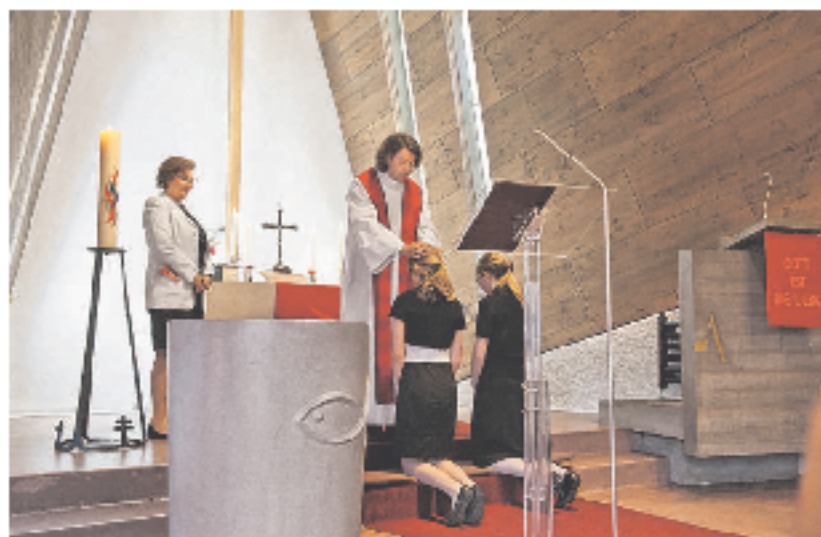
Kniend vor dem Pfarrer: Die Konfirmation bei den Lutheranern in Zürich

Das Glaubensbekenntnis, das in der zweiten Hälfte des 19. Jahrhundert beinahe die reformierte Landeskirche in Zürich gespalten hatte und zur soge-