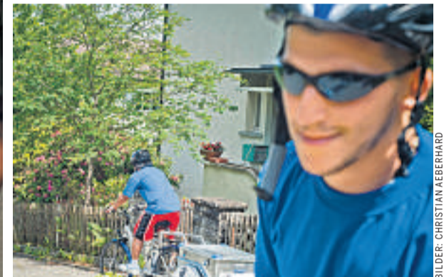
Der Heks-Lieferdienst: umwelt- und menschenfreundlich