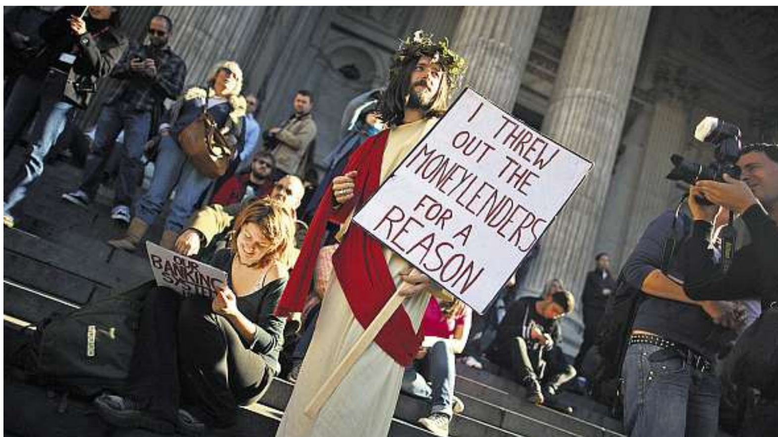
«Ich warf die Geldverleiher hinaus – und dies mit Grund»: Ein als Jesus verkleideter Demonstrant vor der Londoner Börse

VERBEUGEN. Liebe Zugbegleiterinnen und Zugbegleiter: Für das gute Klima während einer Reise braucht es nicht bloss Klimaanlagen – es braucht vor allem Menschen wie euch. Kein Computer vermag die gute Botschaft zu ersetzen, die ihr durch die Wagen trägt: «Danke», «Dankeschön», «Merci vielmal». Wer so viel «Danke» sagt wie ihr, hat am Ende eines Jahres selber ein grosses «DANKEN» verdient! Und ich Schimpfer verbeuge mich vor euch Meisterinnen und Meistern in der Kunst des Dankens.