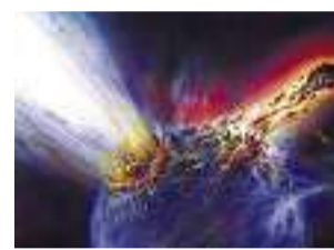
Apokalypse: eine Explosion?

Ich weigere mich, im Kino den Weltuntergang mitzuverfolgen. Millionen von Menschen sitzen gebannt vor der Leinwand und erleben mit weit aufgerissenen Augen, wie Meteorite und Monster, Bom-