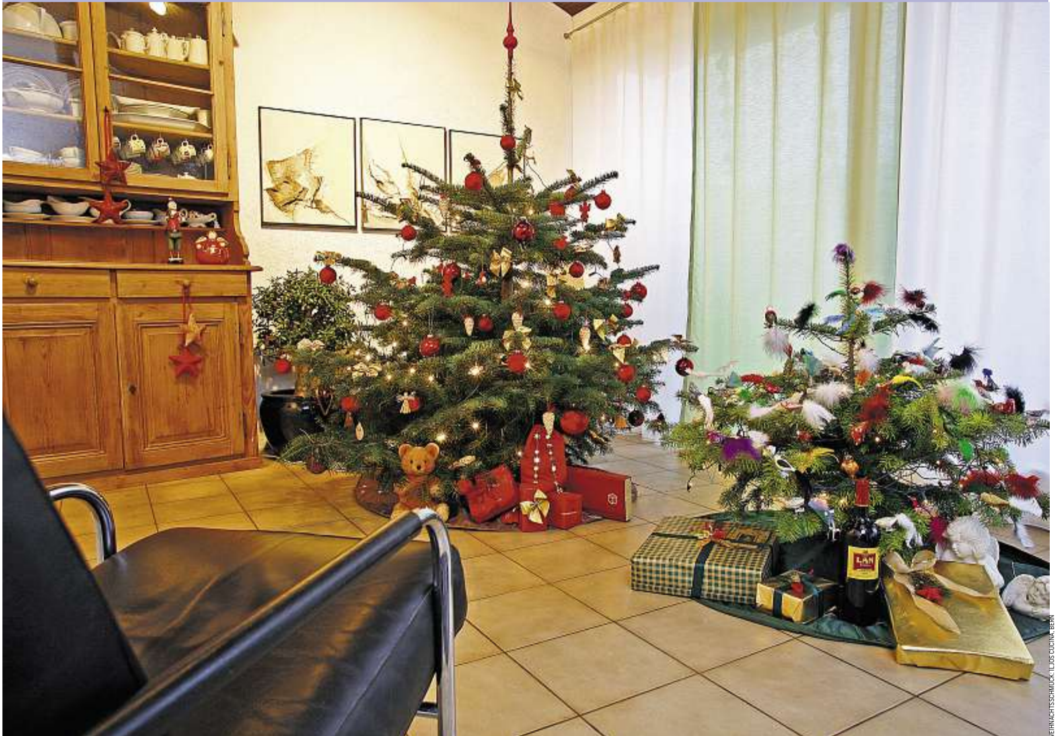
Wenn zwei Weihnachtstraditionen nicht unter einen Baum passen, ist Kreativität gefragt

WIE IMMER/ Eine Frau erzählt, warum in ihrem Dreigenerationenhaushalt jeden Tag Weihnachten ist