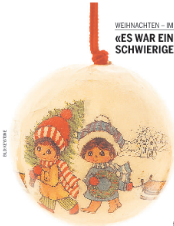
WEIHNACHTEN – IM SPITAL «ES WAR EINE SCHWIERIGE GEBURT»

WEIHNACHTSGESCHICHTEN/ An Weihnachten möchten die meisten Menschen bloss nichts Neues, keine Experimente. Was aber, wenn die Heilige Nacht Fünf Menschen erzählen von Weihnachtsfeiern, die ganz anders herauska