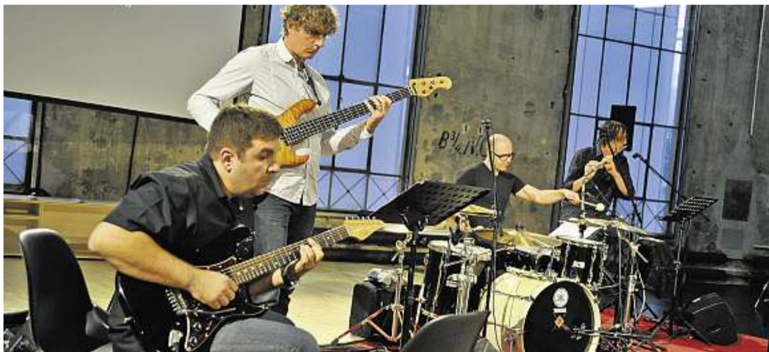
Hier wird schon Populärmusik gespielt: Zweiter kantonaler Singtag der reformierten Landeskirche St. Gallen vom 24. Oktober 2011