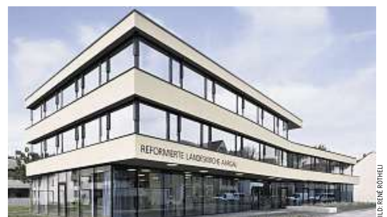
Das neue «Haus der Reformierten» am Stritengässli in Aarau

Mut», sagte er. Insbesondere, so führte er aus, in einer Zeit, in der Religion immer unverbindlicher werde und das Wissen um christliche Werte abnehme. Am Stritengässli – so viel lässt sich nach dem Einweihungstag vermuten – wird man diese Tendenz nicht einfach so hinnehmen. ANOOUK HOLTHUIZEN