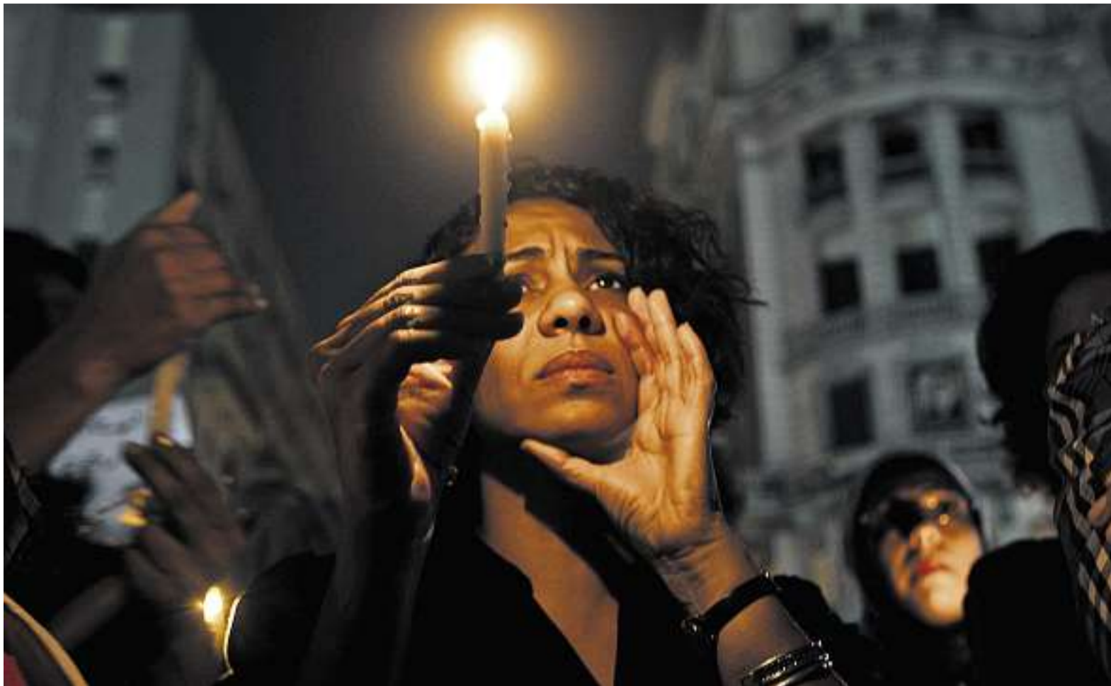
Stiller Protest gegen das Massaker an koptischen Christen Anfang Oktober in Kairo