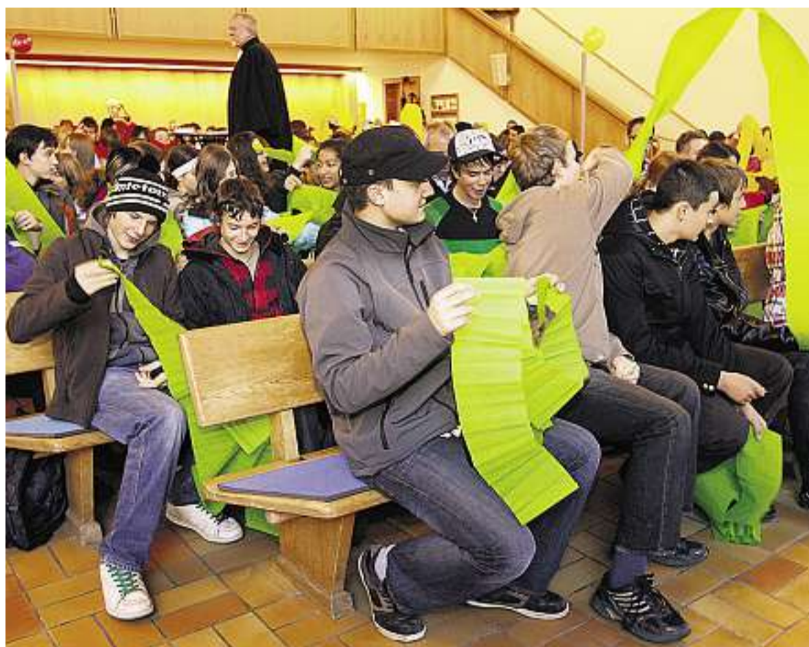
Gemeinschaft erleben einmal anders: Jugendliche am ersten Youtreff in der Commanderkirche in Chur

GEPREDIGT AM 24. Oktober 2010 in Luzeln.