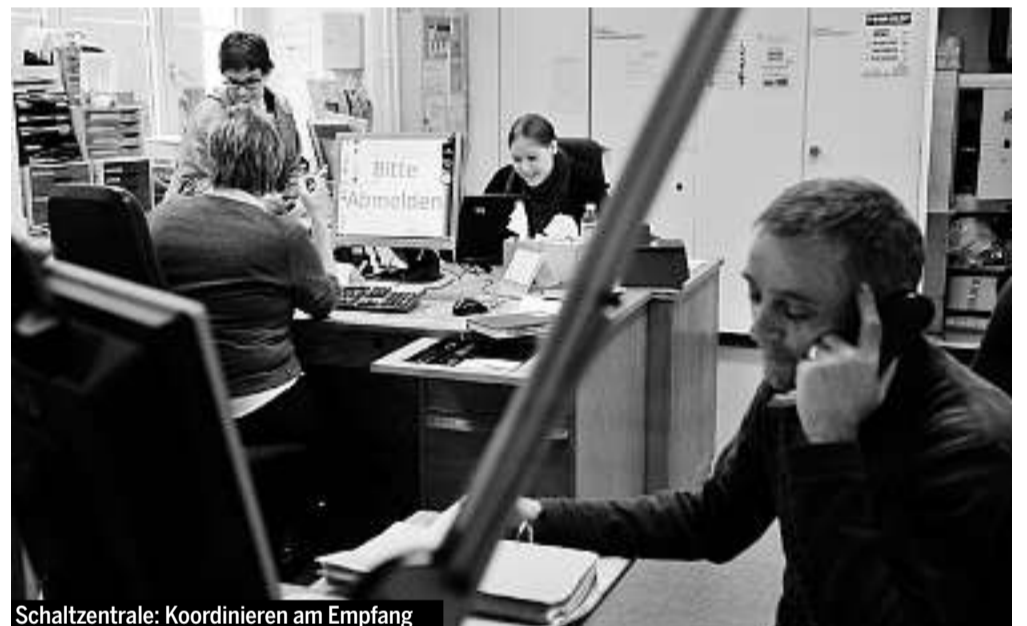
Schaltzentrale: Koordinieren am Empfang