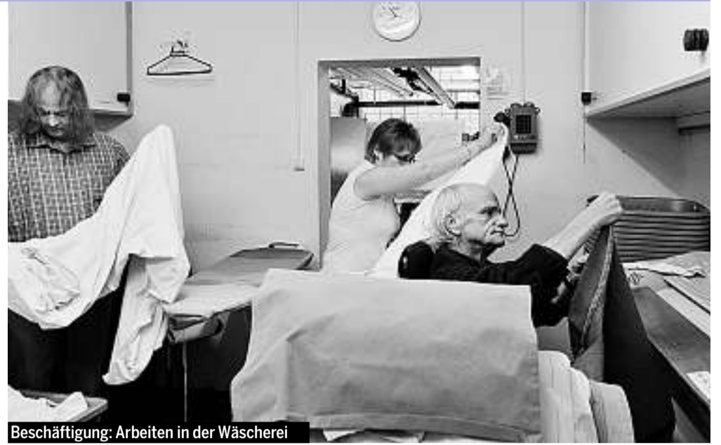
Beschäftigung: Arbeiten in der Wäscherei

*Die Namen aller Bewohner sind geändert.