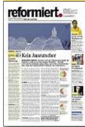
REFORMIERT. 11/10: Dossier Minarettverbot war kein Ausrutscher