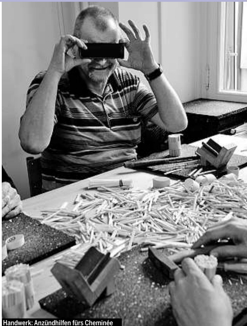
Handwerk: Anzündhilfen fürs Cheminée