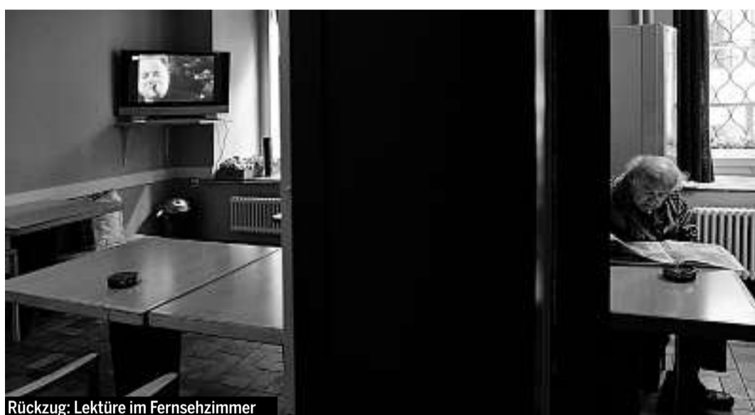
Rückzug: Lektüre im Fernsehzimmer

► ter sich. Wer sie zur Abstinenz zwingt, schränkt ihre Lebensqualität ein», sagt Wirz nüchtern. Trotzdem kommt das Bier nur im Bauch in die Herberge – nicht in der Büchse. Wer Alkohol reinschmuggelt, muss mit einer Verwarnung rechnen, und fortgesetzte Regelverstösse können zum Ausschluss führen.