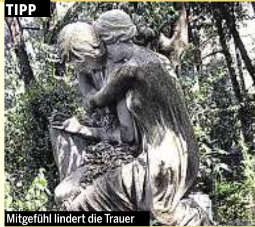
Mitgefühl lindert die Trauer