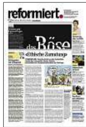
REFORMIERT. 10/10: Dossier «Das Böse»