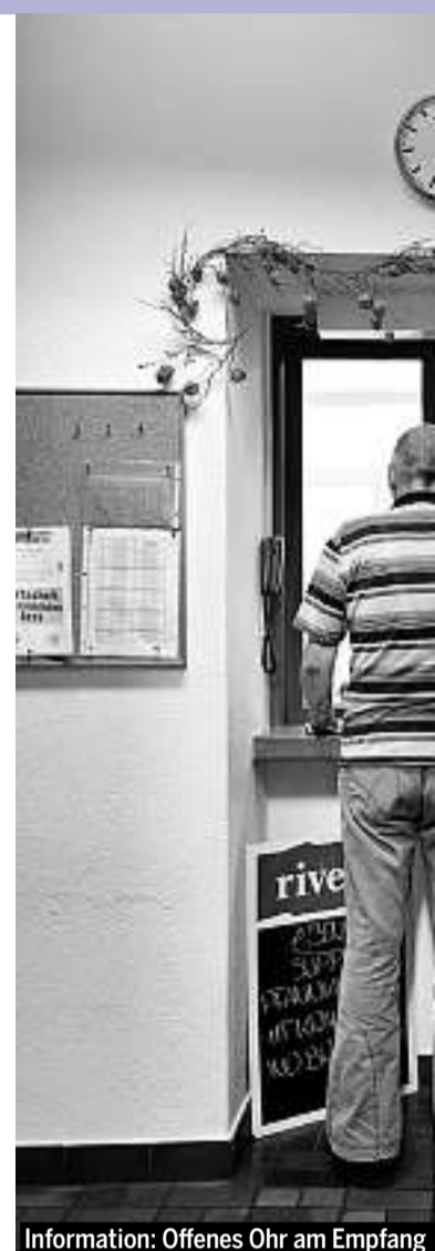
Information: Offenes Ohr am Empfang