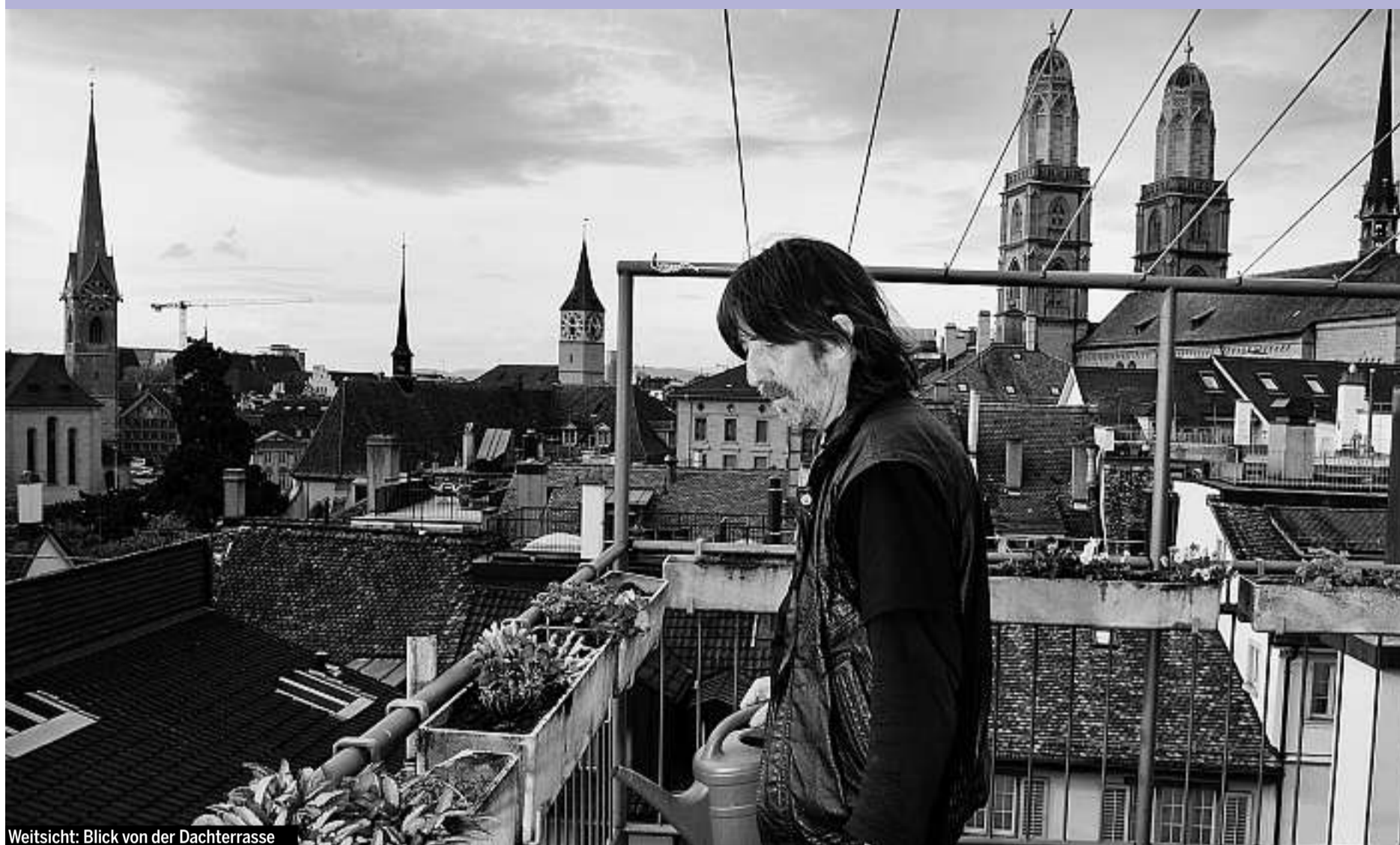
Weitsicht: Blick von der Dachterrasse