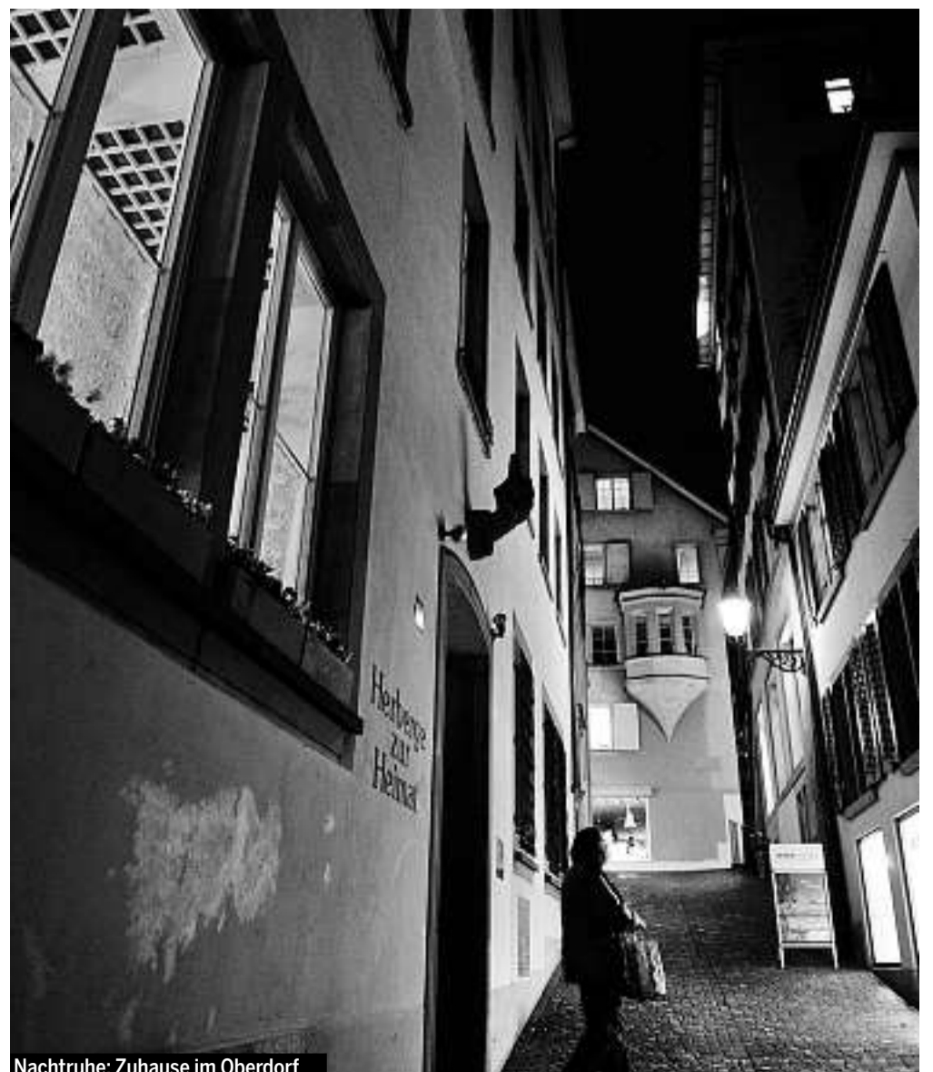
Nachtruhe: Zuhause im Oberdorf