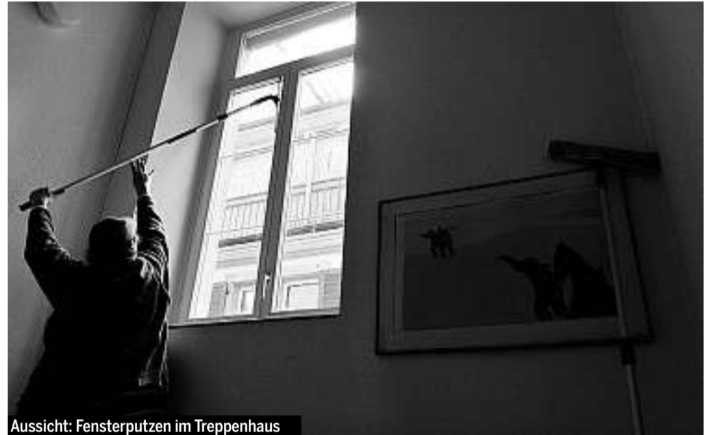
Aussicht: Fensterputzen im Treppenhaus