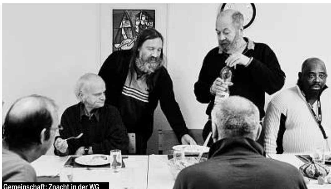
Gemeinschaft: Nacht in der WG