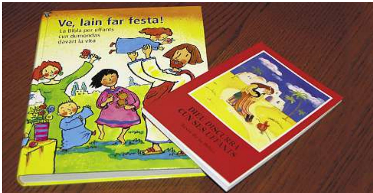
Zwei Kinderbibeln gibt es nun in Rumantsch Grischun – eine dritte soll demnächst erscheinen