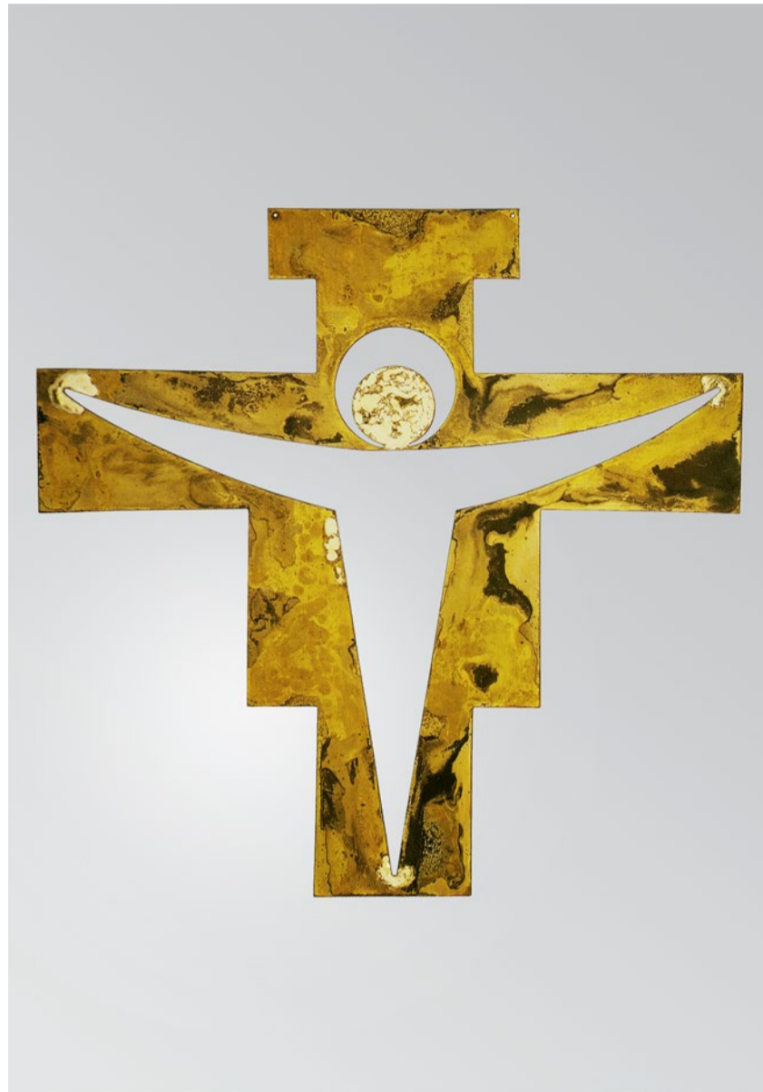
Der Auferstandene ist Luft: Ikone von Josua Boesch.

Manches verbrannte freilich im Feuer der Wandlung. So litt seine