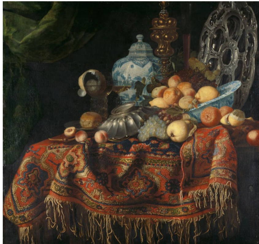
Stilleben von Simon Luttichuys (zugeschrieben).

Barock. Zeitalter der Kontraste. Bis 15. Januar, Landesmuseum, Zürich