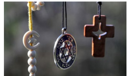
Religionen im Dialog.