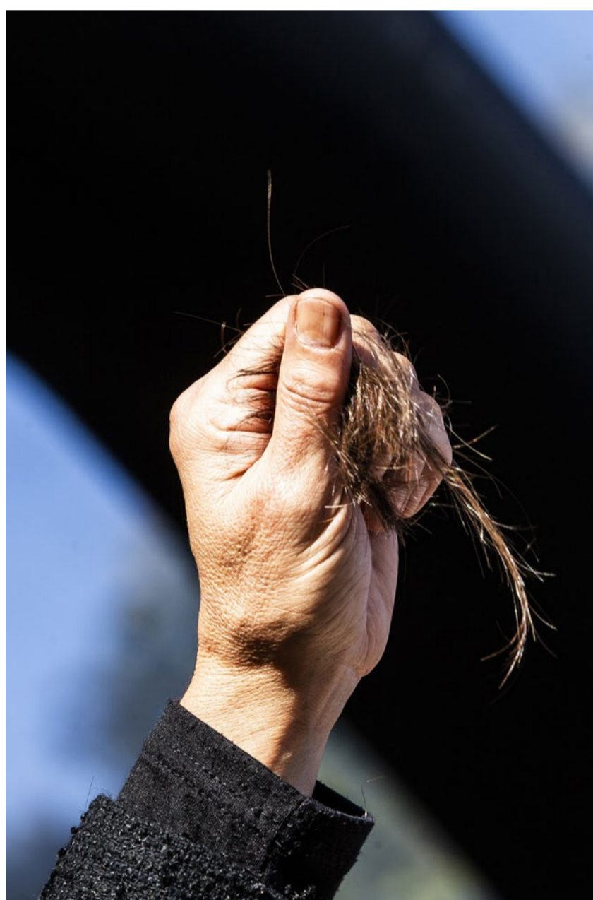
Eine Frau schneidet sich aus Solidarität mit Iranerinnen Haare ab.

Die aktuellen Proteste sind also mehr als der Widerstand gegen die Zwangsordnung, ein Kopftuch zu tragen, und mehr als ein Kampf für Frauen- und allgemeine Menschenrechte. Es ist der Versuch, eine Diktatur zu stürzen. Die Mobilisierung in der Bevölkerung habe ein noch nie da gewesenes Ausmass erreicht, hält der Irankenner Schulze fest. Lediglich noch geschätzte 15 bis 20