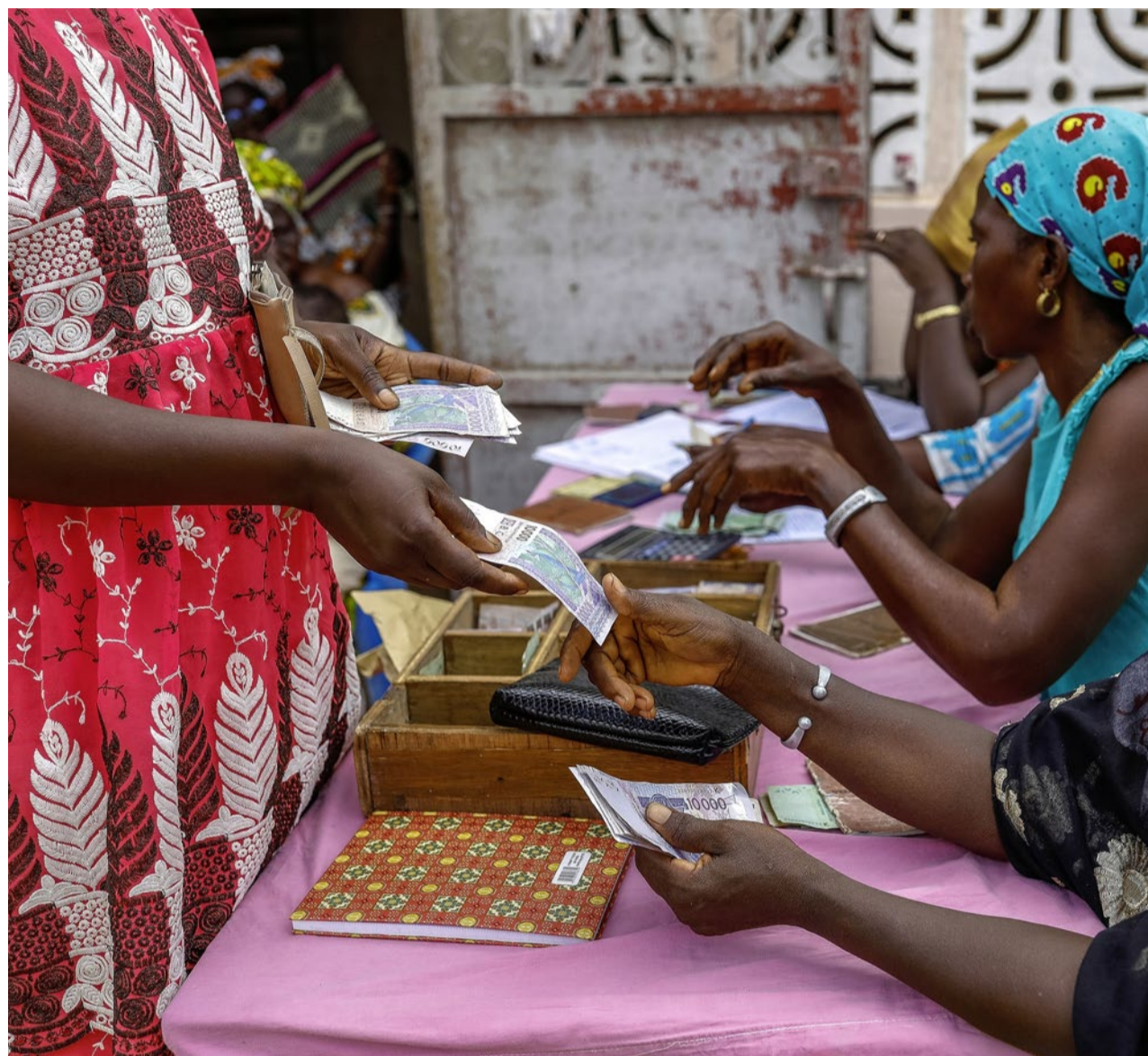
Teilhabe am Finanzwesen dank Mikrofinanzinvestitionen: Frauen im Senegal.