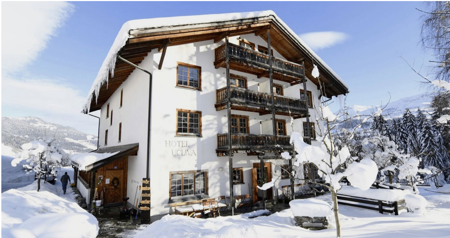
Der Bau des Hotels in Waltensburg durch die Genossenschaft Ucliva in den 80er-Jahren war eine Schweizer Pionierleistung.