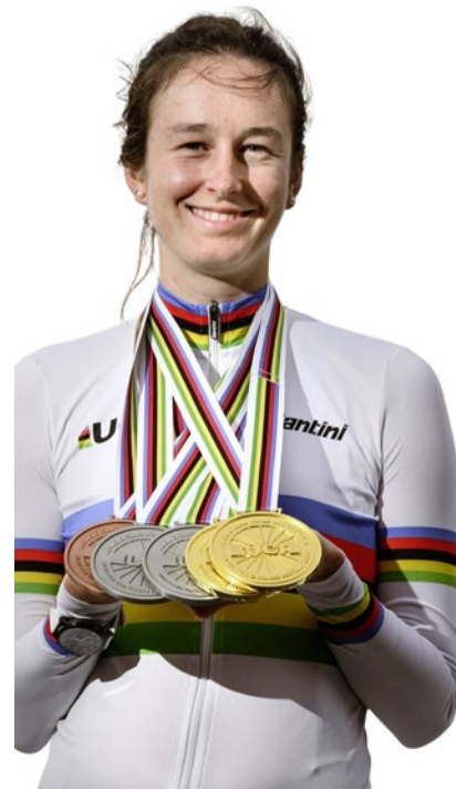
Flurina Rigling (28) ist 2024 Weltmeisterin im Strassenrennen geworden.