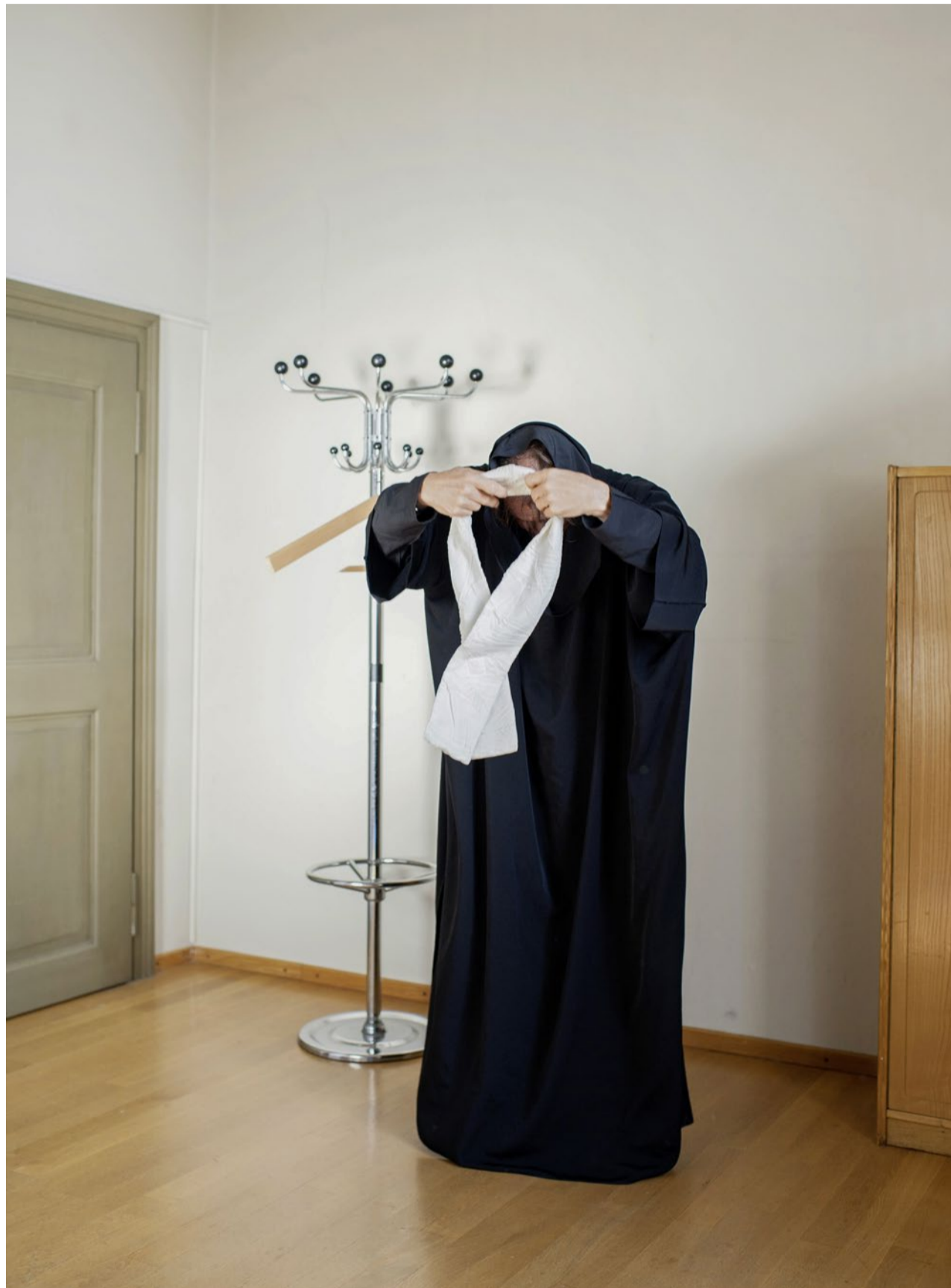
Der Unterschied bleibt: Nur Theologinnen und Theologinnen erhalten die Wahlfähigkeit.

Der «Plan P» soll die Anstellungsbedingungen für Interessenten ohne Pfarrausbildung harmonisieren und eine verbindliche Schulung etablieren. Thomas Schaufelberger, der die Aus- und Weiterbildung der Pfarrerinnen und Pfarrer leitet, geht davon aus, dass das Programm nur für die nächsten zehn Jahre nötig ist. Deshalb richtet sich das Angebot an Akademiker ab 55 Jahren. Pro Jahr müssen voraussichtlich rund 30 Personen angestellt werden. Schaufel-