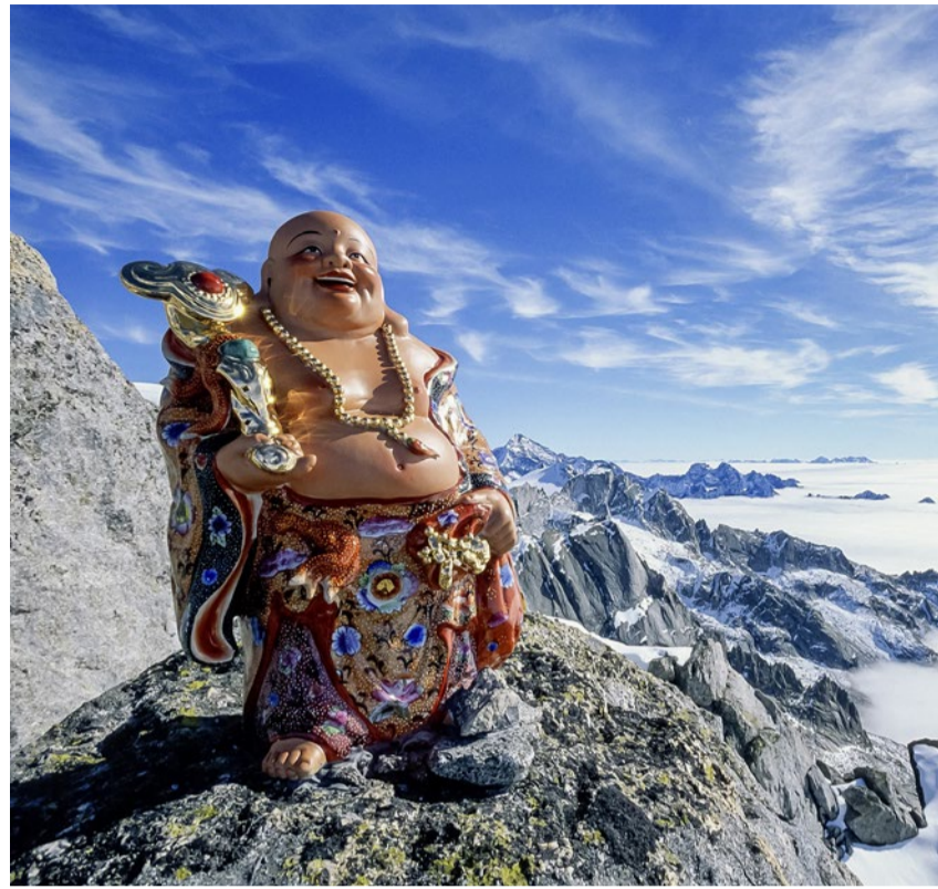
Protest gegen Gipfelkreuze: Lachender Buddha auf dem Badile.

A.-K. Höpflinger u. a. (Hg.): Grenzgänge. Religion und die Alpen. TVZ, 2024