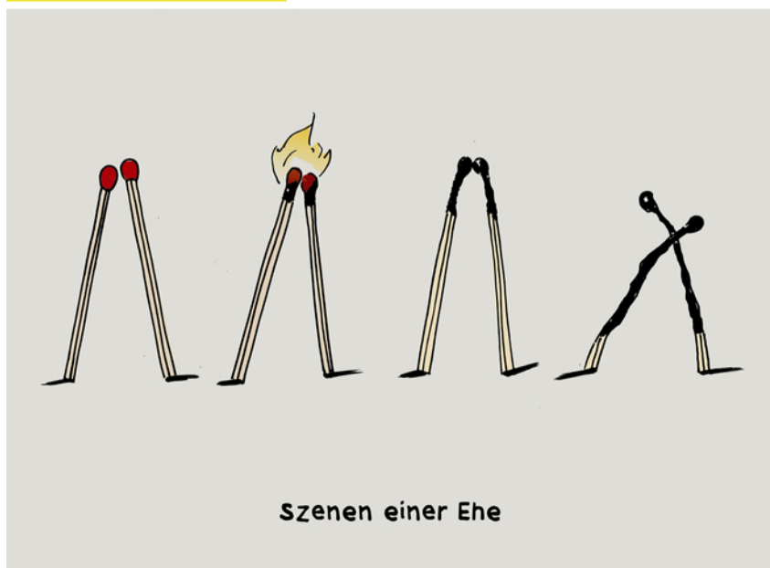
Szenen einer Ehe