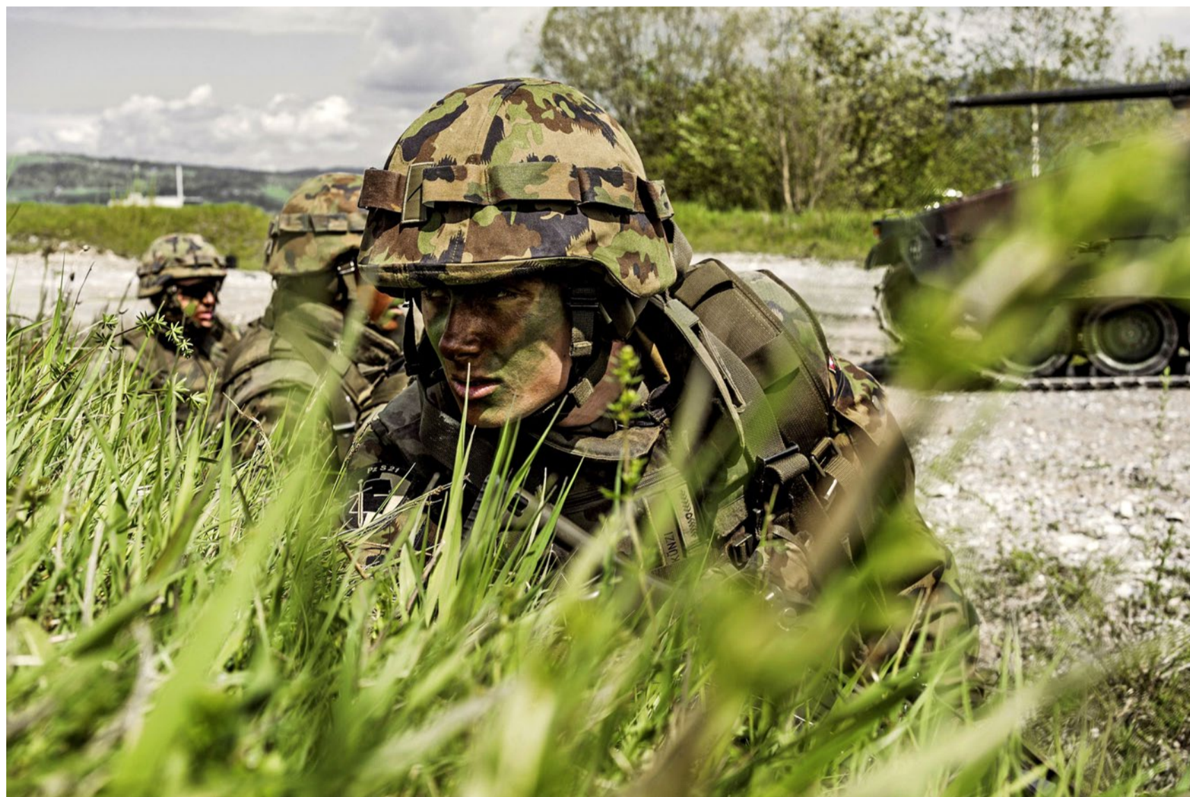
Übungen für einen Ernstfall: Schweizer Soldaten in Deckung.

Gesellschaft Die aktuelle geopolitische Lage spiegelt sich in der Arbeit der Armeseelsorgenden wider. Sie bemerken eine ernsthaftere Auseinandersetzung der Soldatinnen und Soldaten mit ihrer Rolle.