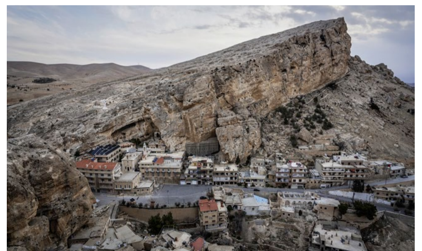
Ungeschützt im Niemandsland: Maalula war im Bürgerkrieg hart umkämpft.

Die Gruppe bespricht die neuesten Gerüchte aus den sozialen Medien. In Aleppo habe man Christen verhaftet, bloss weil sie die Kirchenglocken geläutet haben. Barkil redet beschwichtigend auf die Männer und Frauen im Raum ein, bis sich diese scheinbar beruhigt auf den Weg machen. Was Angst und Ungewissheit bewirken können, zeigt ein Blick auf die Statistik: Bei Aus-