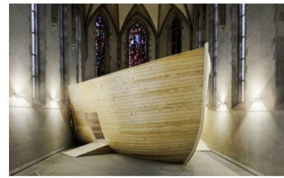
Das Schiff im Kirchenschiff.