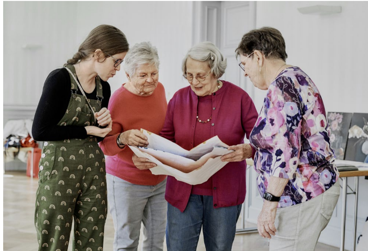
Die Frauen nehmen über den künstlerischen Ausdruck Anteil am Leben und aneinander.

Diakonie Aus der Seniorenarbeit entstanden, ist der Mal-Treff in der reformierten Kirchgemeinde Wädenswil zu einem Kleinod des Gemeinschaftslebens geworden. Hier entwickelt man auf kreative Art Mut.