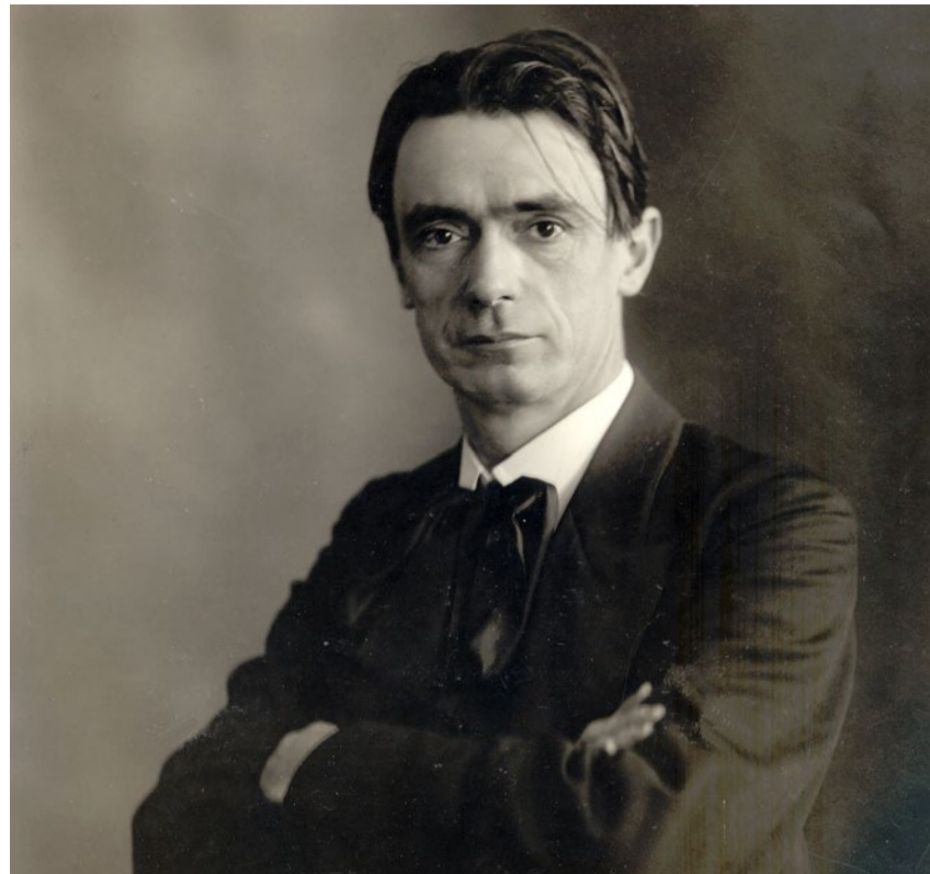
Rudolf Steiner (1861–1925) in einer Aufnahme von 1905.

Rudolf Steiner war Christ und hatte eine eigenwillige Sicht auf Jesus: reformiert.info/steiner