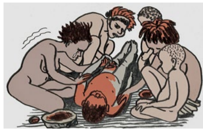
Frauenpower anno dazumal.