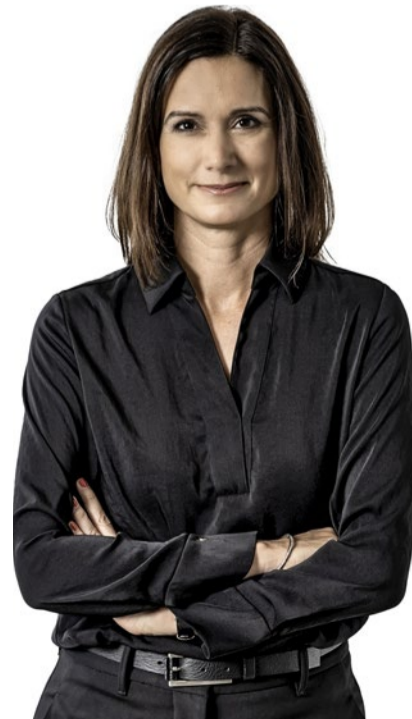
Maja Riniker (47) ist dieses Jahr Nationalratspräsidentin. Die Aargauerin ist Mitglied der FDP.