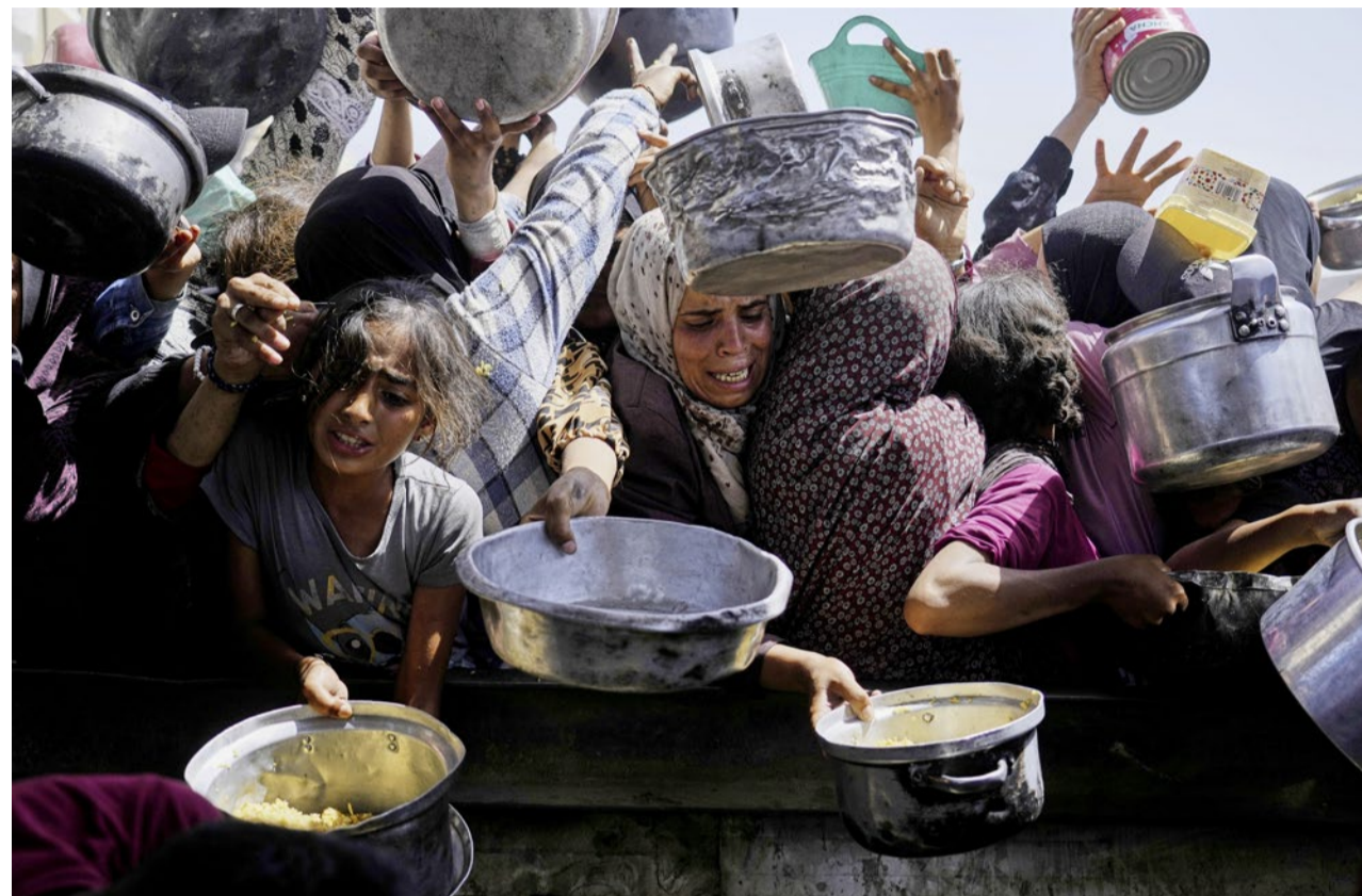
Prekäre Verhältnisse in Gaza: Palästinenserinnen am 16. Mai bei der Essensausgabe in Chan Junis.

Hilfswerk Die humanitäre Krise im Gazastreifen verschärft sich, Hunger macht sich breit. Auch das Hilfswerk Heks steht wegen Blockaden, Hürden und Risiken vor grossen Herausforderungen bei der Verteilung der Hilfe.