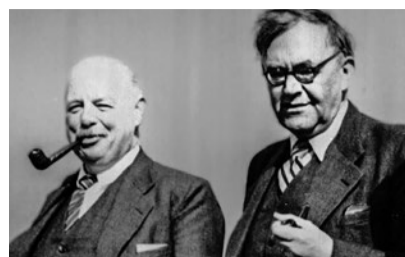
K. Barth und A. Frey