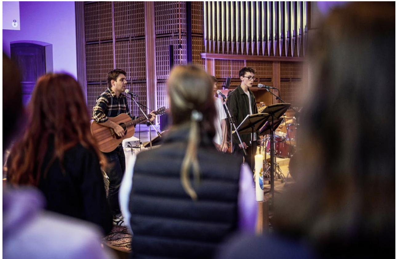
Mal lustig, mal leise und immer offen: Der ökumenische Jugendgottesdienst Praise 9.

Nach dem Einstieg mit dem «Mentimeter», der Stimmung und Erwartun-