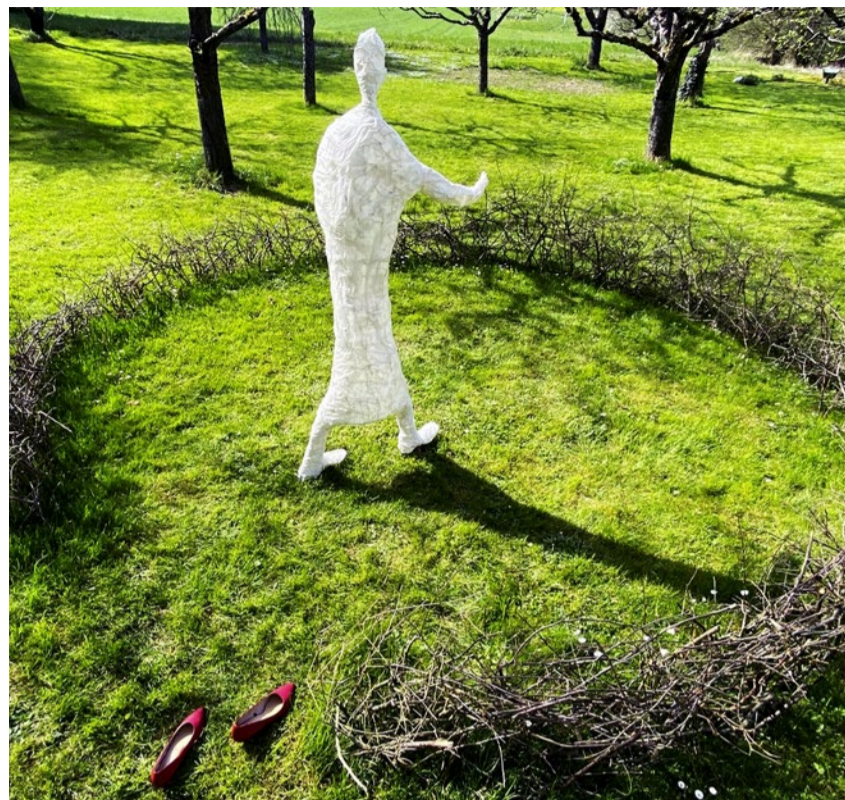
Märchenhafte rote Schuhe: Das Werk «Innere Einkehr» von ULTI.

Back to the Roots: bis 7. September, Galerie Weiertal Winterthur, www.galeriewiertal.ch