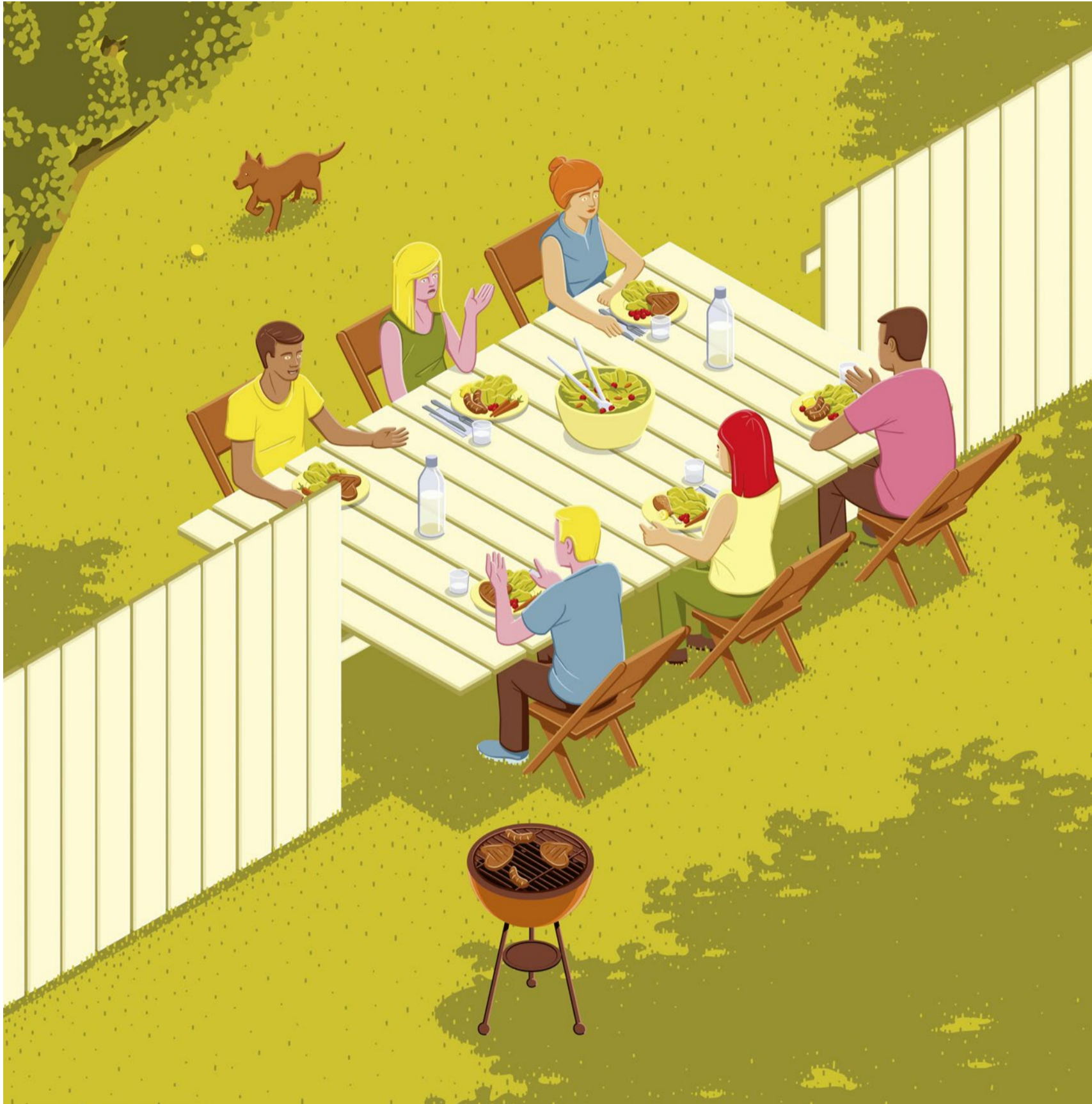
Illustration: Stephan Schmitz