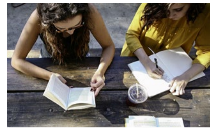
Und das Kopfkino läuft.