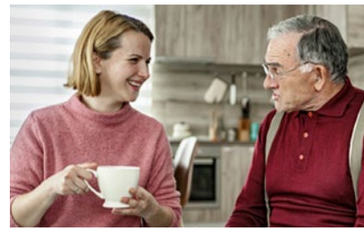
Familienrollen ändern sich.