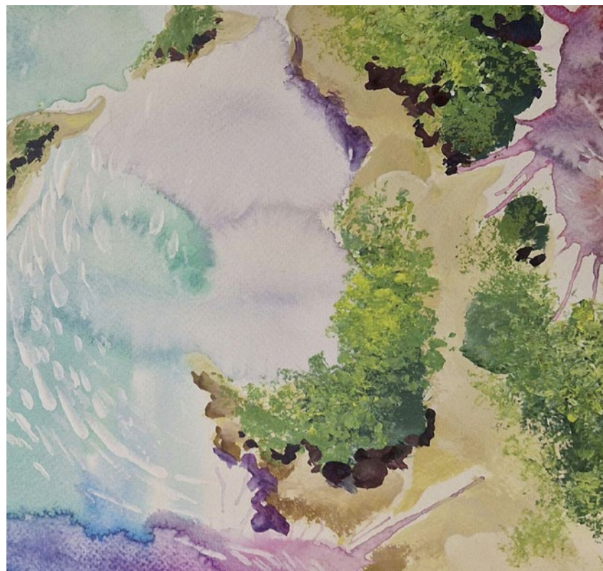
Der Verein Netzwerk Kunsttherapie Integration schafft Kreativraum.

Der Verein Netzwerk Kunsttherapie Integration zeigt erstmals die Werke des Projekts «Malen und Gestalten für Geflüchtete». Die an der Ausstellung gezeigten Bilder geben einen Einblick in das Schaffen der aktuellen Gruppe und in die kunsttherapeutische Arbeit des Vereins. An der Vernissage am 7. Mai um 17.30 Uhr sind auch die Kursteilnehmenden und das Leitungsteam anwesend. Sie freuen sich auf die Gespräche beim offerierten Apéro. rig