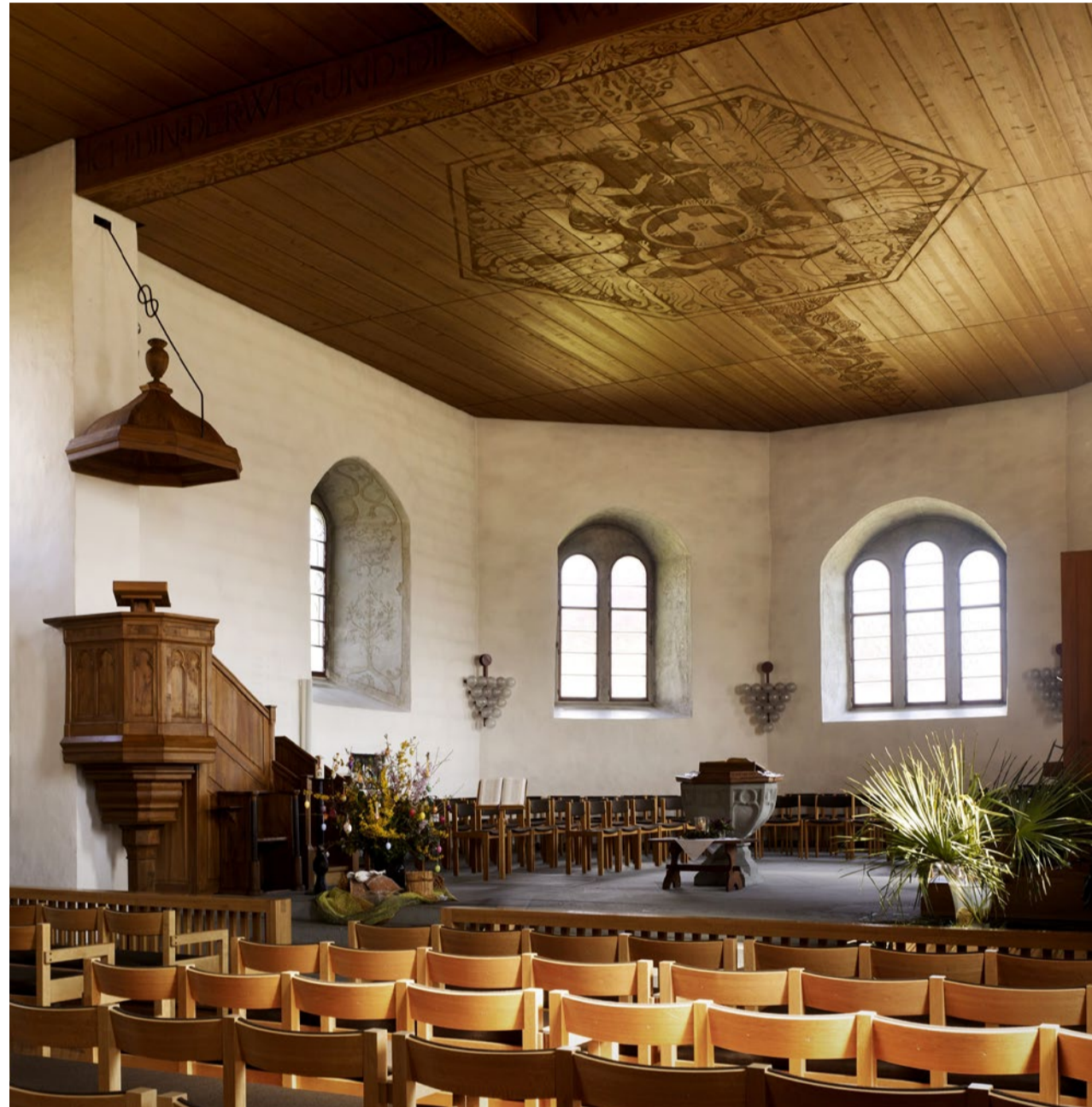
Vor 900 Jahren geweiht, vor 360 Jahren erweitert: Blick in den Chor der Kirche Marthalen.

Geschichte Die Wurzeln der Kirche Marthalen reichen 900 Jahre zurück. Die Kirchgemeinde feiert das Jubiläum mit einem Festgottesdienst und einer Veranstaltungsreihe, die auch ein Stück Dorfgeschichte erzählt.