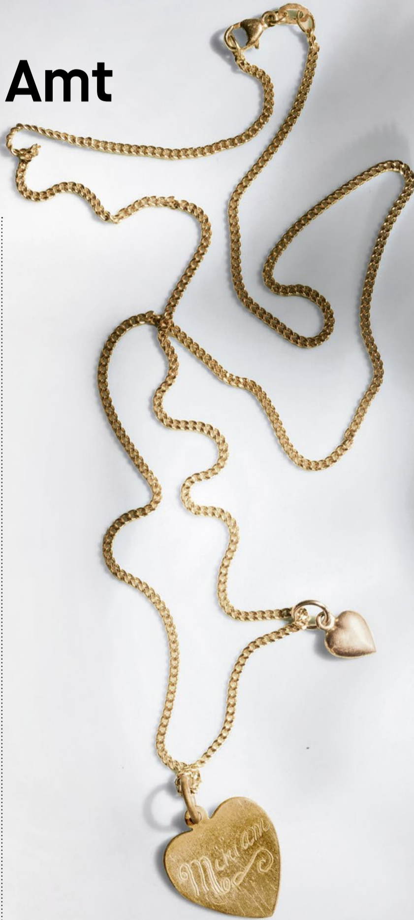
Namenskette fürs Patenkind: Geschenktraditionen erleichtern die Entscheidung.