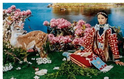
«Spring – Four Seasons».