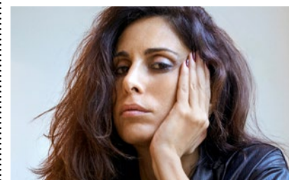
Yasmine Hamdan.