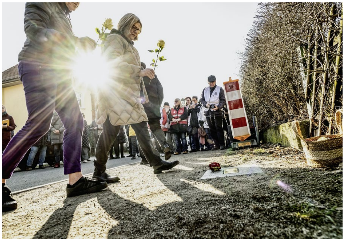
«Von Stolperstein zu Stolperstein werden wir mehr»: Gedenken heisst Widerstand.