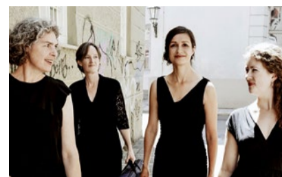
Ensemble Per-Sonat.