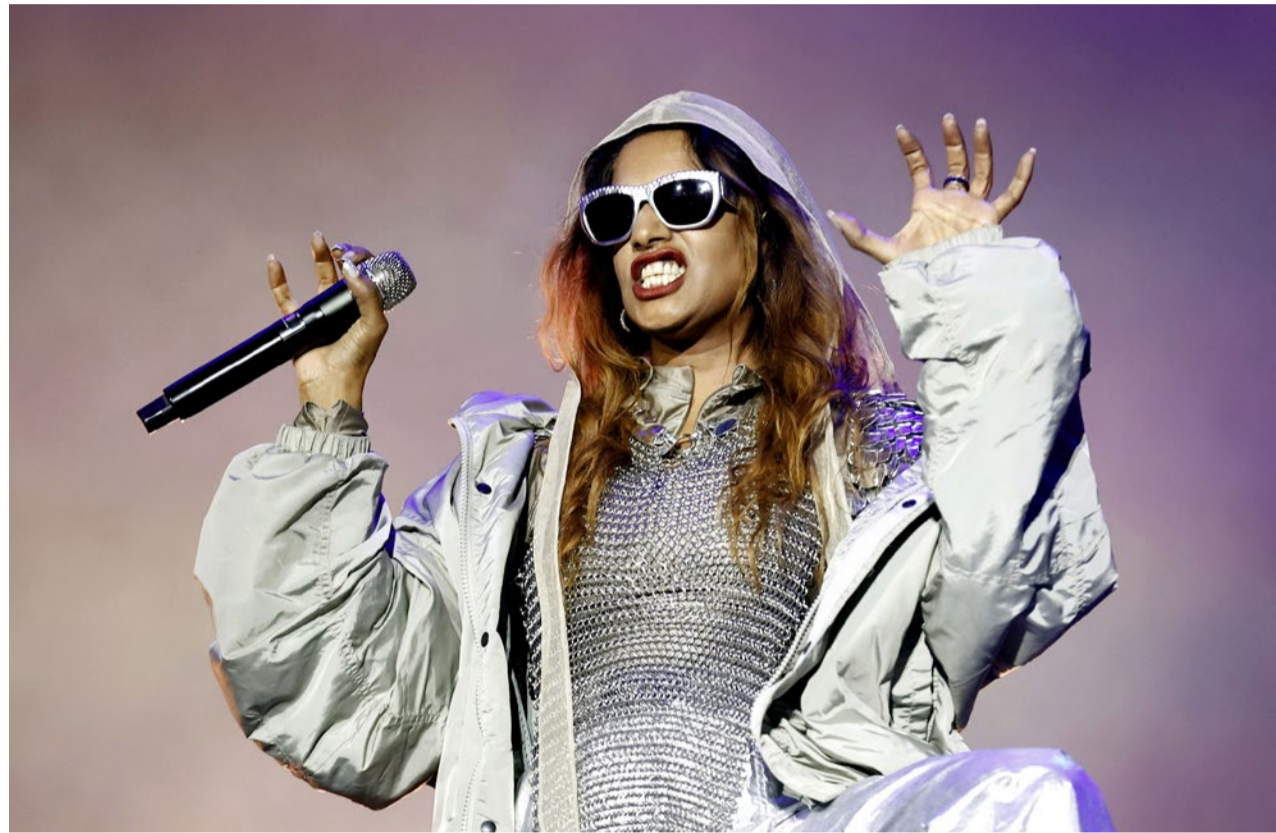
Politische Geisterfahrer:in: M.I.A. trägt ihre selbst vermarktete Mode, die vor Strahlung schützen soll.

Natürlich verbannten die kommerziellen Portale das Video flugs aus dem Netz. Arulpragasam kommentierte lakonisch, sie habe lediglich «mit etwas Kunstblut» Verbre-