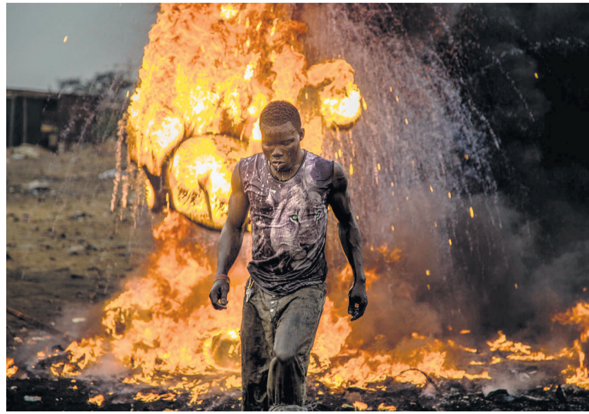
Die Feuershow nach Feierabend und der Wasserverkauf der Mädchen: Beklemmend ästhetische Bilder des Alltags im Elektroschrott.

Religion Auch in Religion gibt es nichts, was es nicht gibt. Pfingstlerisch inspirierte Kleinstgemeinden in den USA berufen darauf, was in Markus 16,18 jenen versprochen wird, die «zum Glauben kommen»: «Schlangen werden sie mit blossen Händen aufheben, und tödliches Gift wird ihnen nicht schaden.» Stirbt der Priester, der mit Klapperschlangen um den Hals predigt, an einem Biss, wird sein Tod als Urteil Gottes interpretiert. West Virginia ist der einzige Bundesstaat, der die Schlangenmessen noch erlaubt. fmr