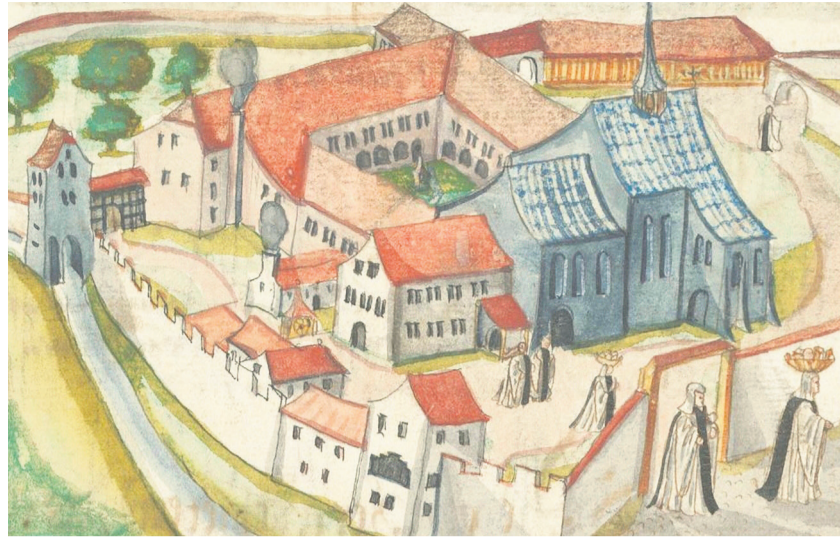
Nonnen verlassen das Kloster Oetenbach in Zürich.

Mit wenigen Fussnoten kommt das soeben erschienene Buch «Verfolgt, verdrängt, vergessen?» daher, das auch manche seiner Inhalte im Zürcher Stadthaus mit dem programmatischen Titel «Schatten der Reformation» ausstellt. Die Beiträge sind knapp gehalten und verständlich formuliert. Da erinnert