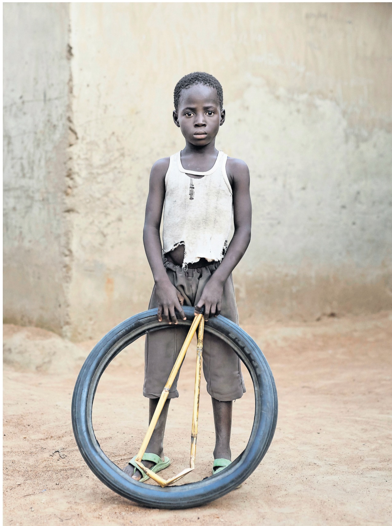
Bub im Flüchtlingsdorf: Nach der Flucht vor den Terrormilizen hat auch das Spiel wieder Platz.