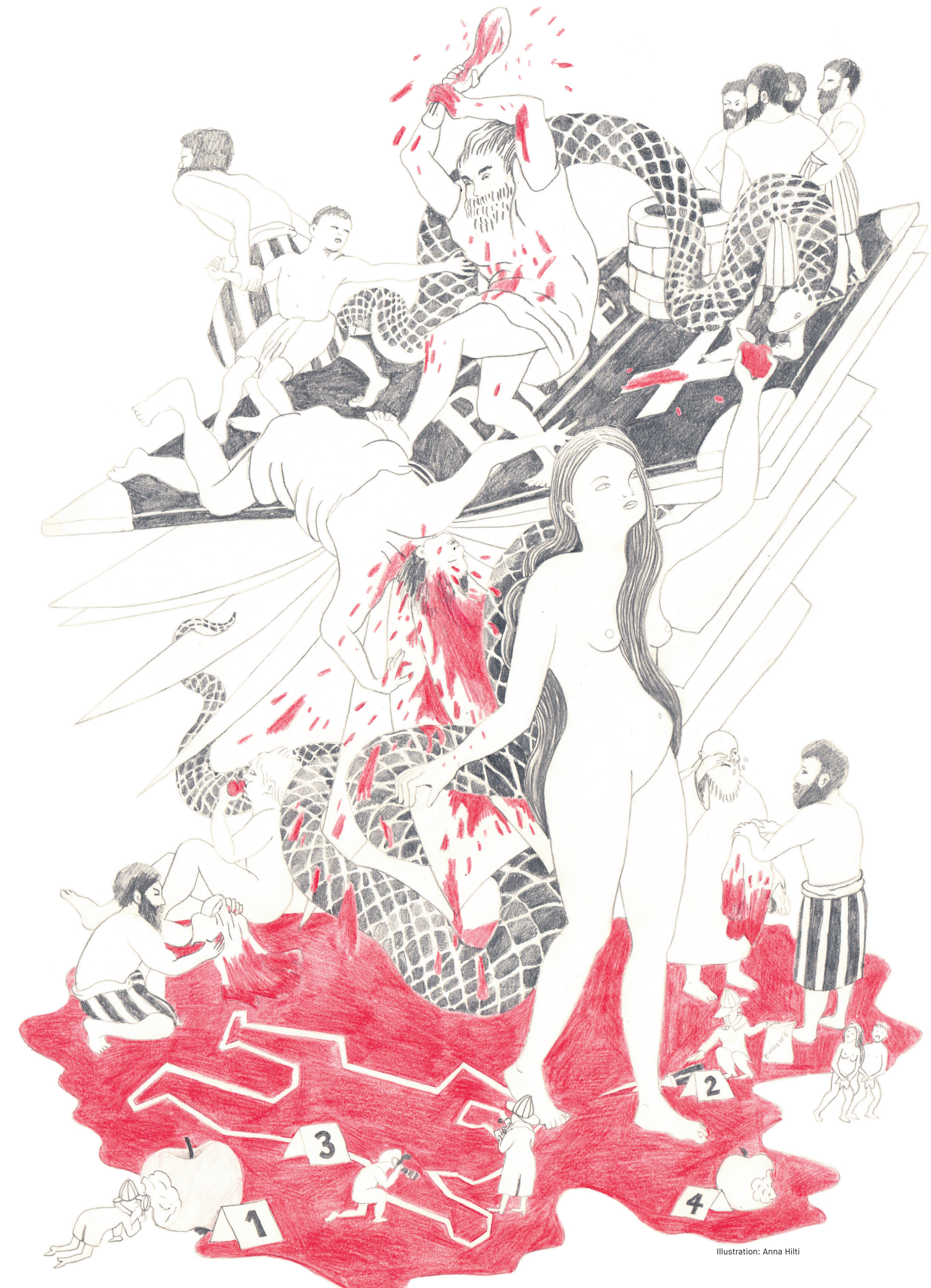
Illustration: Anna Hilti

Davon ist auszugehen. Aber das muss ja nicht heissen, dass auch ihre Literatur in religiösen Milieus angesiedelt ist. Hier ist die Versuchung von Klischees gross. Denken Sie an historische Krimis, an Verschwörungstoffe, die von der hierarchischen Struktur der katholischen Kirche Gebrauch machen. Gerade die katholische Kirche liefert dankbaren Krimistoff. Auch, weil sie viele Rituale pflegt, das Zölibat hat und immer wieder von Missbrauchsfällen erschüttert wird. Man ist schnell mit ihr uneins. Im Krimi ist der Mord im Beichtstuhl klassisch. Im Gegensatz dazu ist die protestantische Kirche eher bloss. Interview: Sandra Hohendahl-Tesch und Cornelia Krause